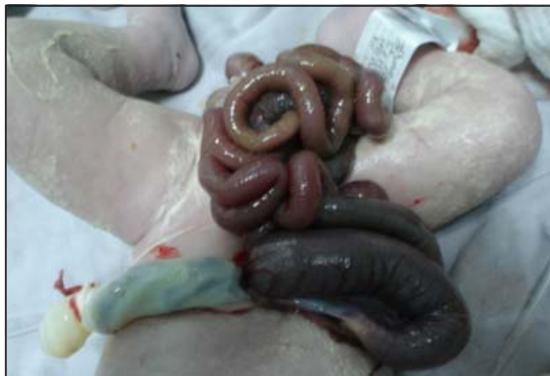
Foto 1. Recién nacido con gastrosquisis. Nótese el defecto de la pared abdominal, es lateral al cordón umbilical y en este caso derecho.

gastroschisis, showing a prevalence of 81.8 per 10,000 and 1 per 122 newborns.