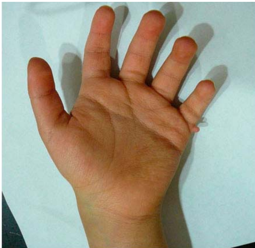
Fig. 1. Mano izquierda. Se observa polidactilia axial, edad 8 años.

El paciente es remitido a la consulta de Genética Pediátrica a los 8 años de edad, y presenta, adicionalmente, retraso en el desarrollo psicomotor y retardo mental severo, dolicocefalia, movimientos repetitivos, hipotonía severa, manchas lineales hipopigmentadas (Fig. 2) y características faciales especiales, como mejillas llenas, labio inferior grueso, paladar ojival, alopecia fronto-temporal (Fig. 3); así como medidas antropométricas talla, peso, perímetro cefálico y medidas craneofaciales entre percentiles 75-95 para la edad. Estudios imagenológicos adicionales (resonancia magnética cerebral) evidenciaron agenesia de cuerpo calloso y megacisterna magna.