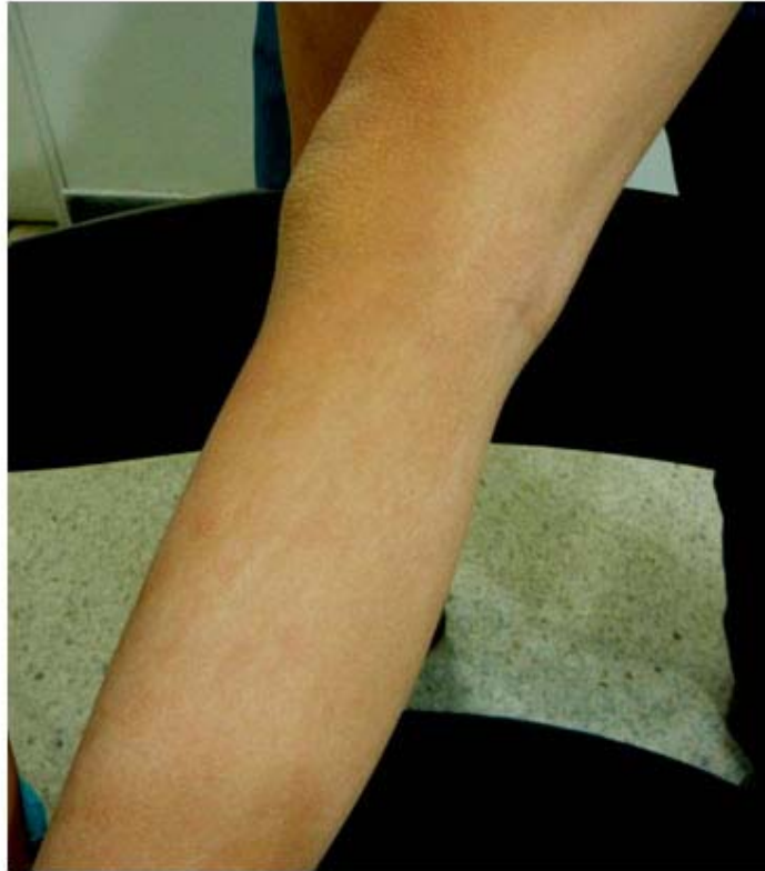
Fig. 2. Se observan líneas hipopigmentadas en la piel.