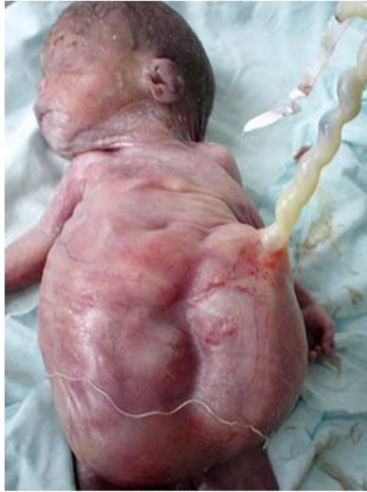
Fig. 1. Recién nacido con características fenotípicas del síndrome de Prune Belly, se destaca la anormalidad de la musculatura de la pared abdominal y la distensión abdominal por uropatía obstructiva.

Los hallazgos fenotípicos del paciente con SPB de la figura 2 , son ejemplos de la variante letal del SPB, que forma parte del grupo de enfermedades que producen la uropatía obstructiva. Esta causa graves alteraciones fetales y muertes perinatales, por lo que se hace necesario más estudios encaminados a entender la fisiopatología de esta condición para iniciar un manejo integral rápido in útero . Además de un diagnóstico temprano, donde se incluya un asesoramiento genético.