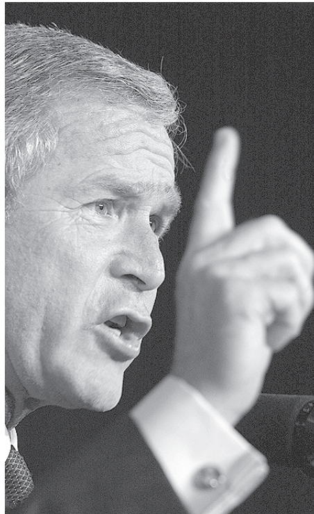
George W. Bush, presidente de los Estados Unidos.

Esto podría empeorar aun más con las recientes elecciones celebradas en Irán donde obtuvo la presidencia Mahmoud Ahmadinejad un radical conservador a quien se le acusó de estar involucrado en el secuestro de los diplomáticos de la embajada estadounidense en Teherán en 1979. A EEUU le preocupa el hecho de que el nuevo presidente iraní haya declarado recientemente que “(...) continuaría con