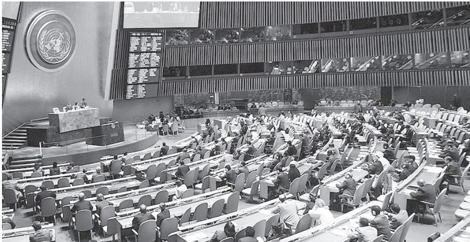
Asamblea general de las Naciones Unidas.

EEUU debería evaluar si con cooperación y formación de alianzas globales es posible lograr una mayor legitimidad en cuanto a la consecución de sus objetivos que haciéndolo de forma aislada. Lo anterior beneficiaría el fortalecimiento de un sistema institucional mundial que garantice una mayor seguridad colectiva. Como plantea Henry Kissinger “ninguna nación por poderosa que sea, puede organizar el sistema internacional por sí misma, pues está por encima de la capacidad psicológica y política del Estado más dominante”, lo anterior por consiguiente