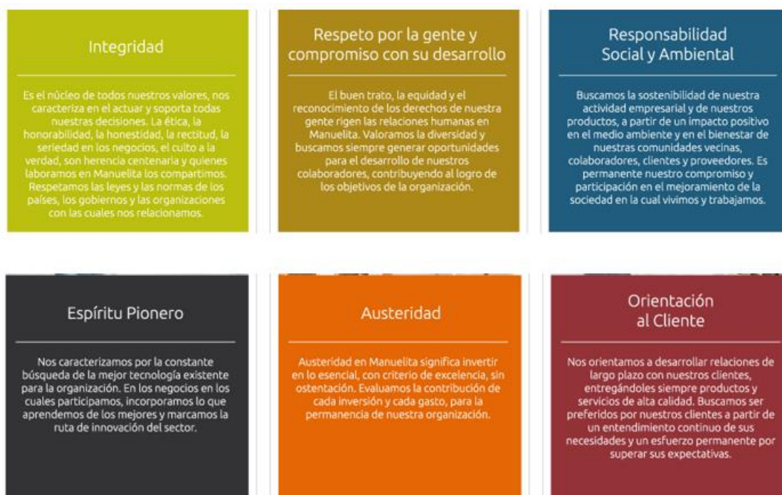
Ilustración 1 Ingenio Manuelita

Fuente: Tomado de http://www.manuelita.com/estrategia-corporativa/ . Valores corporativos