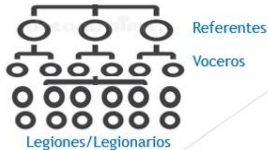
Imagen 1. Jerarquía

Por otra parte, la identidad está muy relacionado con el capital simbólico de Pardey (2001), es otro punto clave ya que el legionario representa intrínsecamente la identidad de la hinchada, la identidad está marcada por la relación con los otros miembros, las persona que conoces en los viajes, además asiste siempre con la indumentaria y vestimenta alusiva al Deportivo Cali.