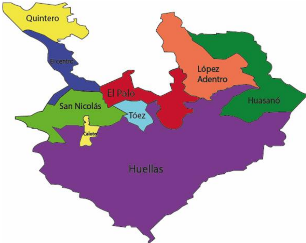
Mapa 2: División por corregimientos y cabildos.

Elaboración propia con datos de la alcaldía de Caloto.