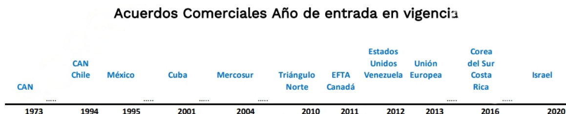
Ilustración 1 ACUERDOS COMERCIALES VIGENTES COLOMBIA

Nota. Adaptado de Acuerdos Comerciales Vigentes COL (Fotografía), por Ministerio de Industria y Comercio, 2020 ( https://www.tlc.gov.co/temas-de-interes/informe-sobre-el-desarrollo-avance-y-consolidacion/documentos/ley-1868-informe-tlcs-2021-congreso.aspx ).