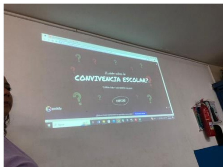
Actividad 3 - Presentación del cuestionario con el programa Genialy.