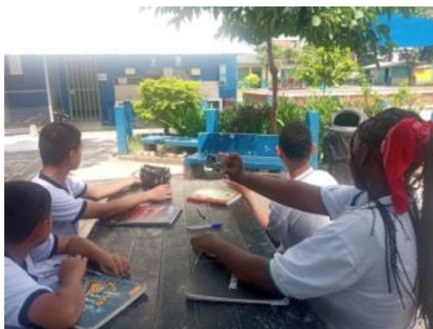
Actividad 1 - Estudiantes resolviendo con las fichas