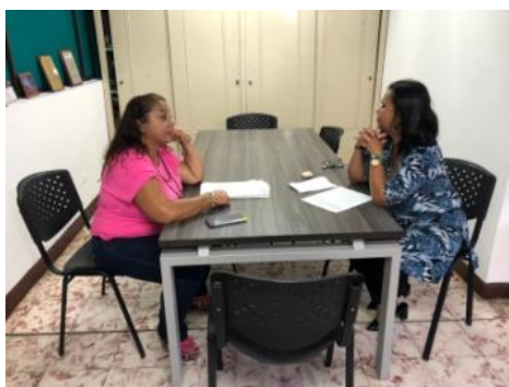
Reunión de socialización con la rectora