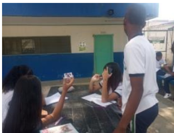
Actividad 1 - Estudiantes jugando con las fichas