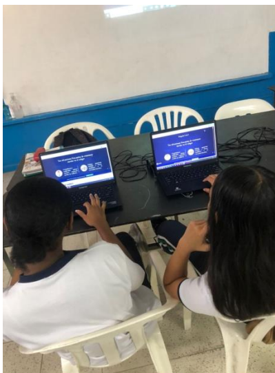
Actividad 3 - Estudiantes solucionan las preguntas en Genialy.