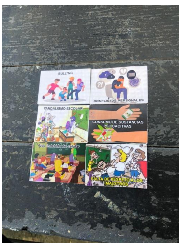
Actividad 1 - Juego creado por los docentes Clarena Cobo y Luis Collazos