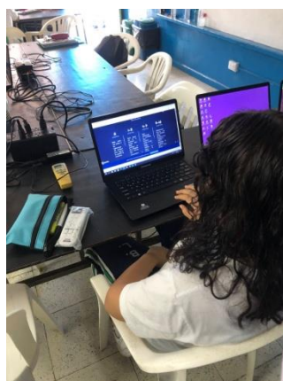
Actividad 3 – Estudiantes respondiendo las preguntas en Genialy