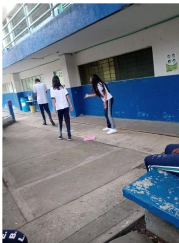
Actividad 2 - Estudiantes imitando situaciones de convivencia