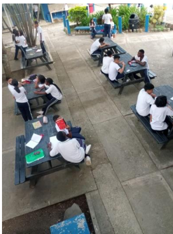
Actividad 2 - Estudiantes planeando la mímica