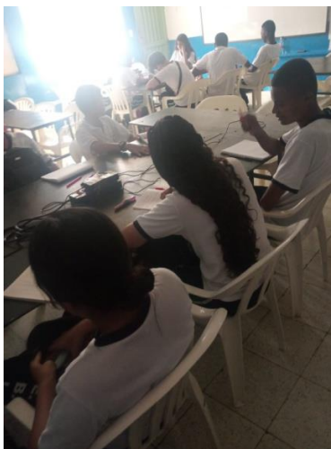
Actividad 1 - Estudiantes planeado en juego