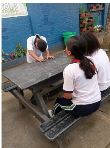
Actividad 2 – Estudiantes representando situaciones