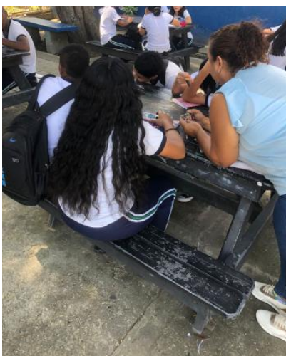
Actividad 1 - Estudiantes concertando