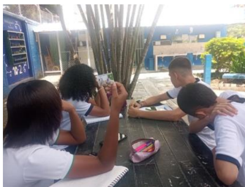
Actividad 1 - Trabajo cooperativo