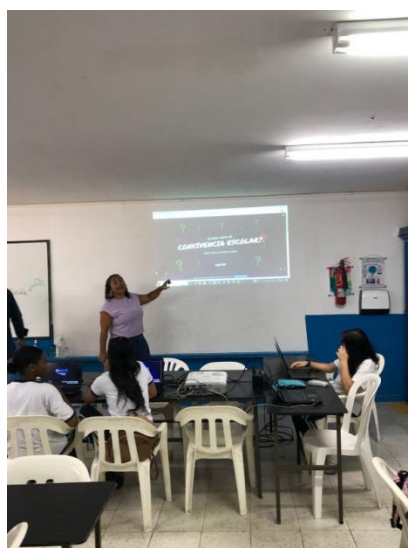
Actividad 3 - Explicación del cuestionario con el programa Genialy