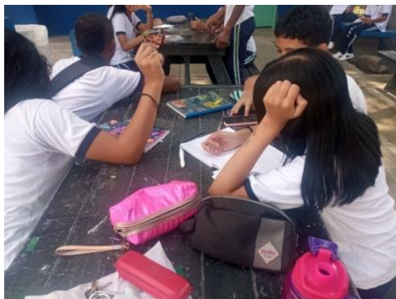
Actividad 1 - Estudiantes concertando en equipo