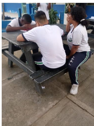
Actividad 2 – Estudiantes recreando situaciones