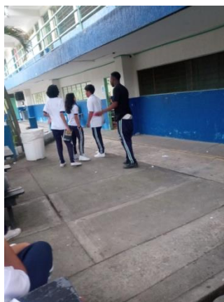
Actividad 2 - Estudiantes actuando