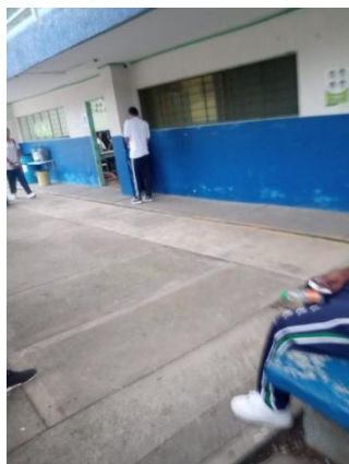
Actividad 2 – Estudiantes actuando