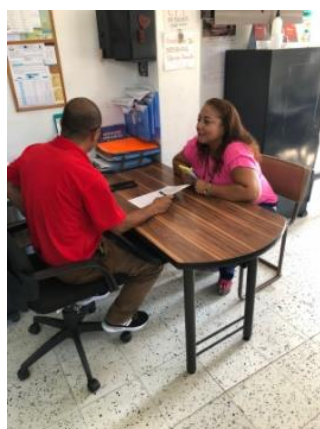
Reunión de socialización con el coordinador