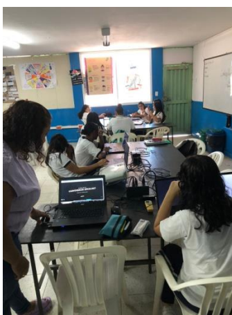
Actividad 3 - Estudiantes resolviendo el cuestionario en Genialy