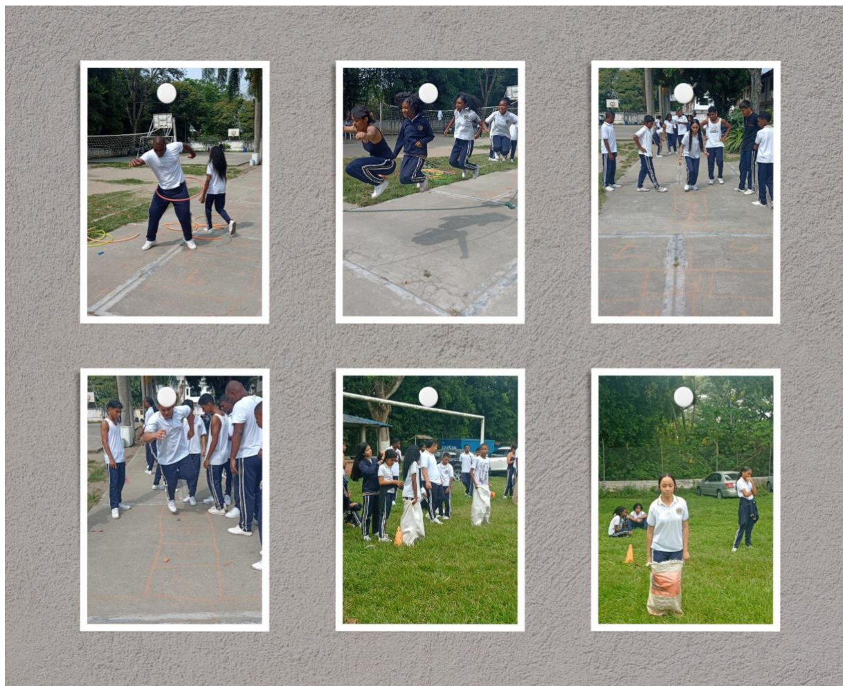
Foto # 3. Actividades lúdicas y juegos tradicionales el recreo escolar

También después de este análisis puedo decir que con dichas actividades se pudo complementar lo plasmado en el marco teórico en cuanto a los conceptos tales como: Convivencia escolar, deporte, recreación y conflicto.