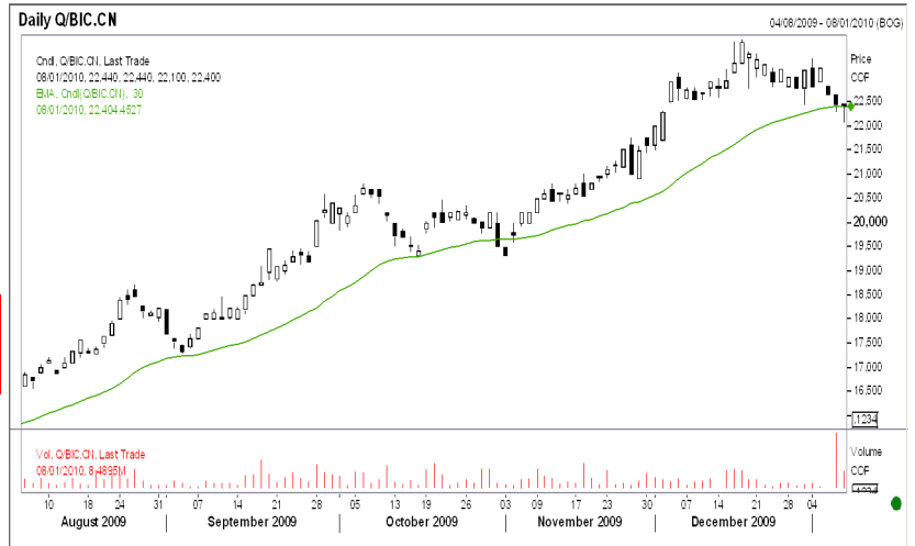
Gráfica: BANCOLOMBIA diaria desde Agosto 2009-Enero 2010 Media exponencial de 40 periodos

La gráfica, muestra la tendencia alcista de la acción de Bancolombia, con una media exponencial de 40 periodos, la cual se utiliza como una línea de tendencia, que va cambiando conforme al mercado. La gráfica comprendida entre agosto del año pasado y enero de 2010, muestra el máximo histórico de la acción, de $23.780 en diciembre de 2009. Durante la crisis económica del 2008, los precios de la acción violaron uno de los soportes históricos de $10.000, alcanzado durante la crisis de los mercados emergentes en junio de 2006.