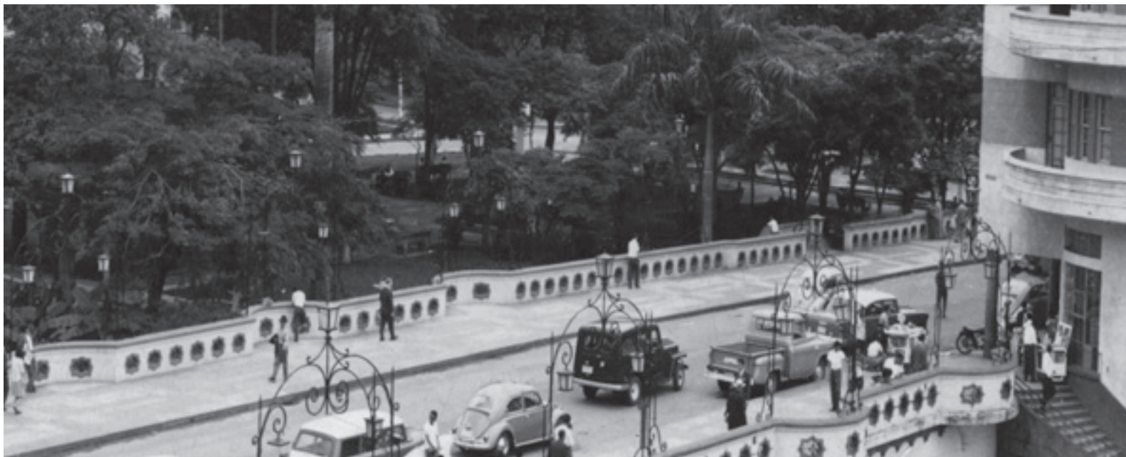
Panorámica del Puente Ortiz. A la derecha se aprecia un fragmento del edificio Gutierrez Velez.

seguir asumiendo que la cultura de protección de lo público y de lo privado viene desde las políticas del gobierno municipal de turno. Debemos asumir una responsabilidad frente a nuestra ciudad; somos responsables de nuestra ciudad, como el Principito de Saint Exupéry lo era de su rosa. Cuando no queremos asumir esa obligación, nada nos cuesta dejar servidos en bandeja a la pica demolidora nuestros mejores recuerdos, hechos arquitectura, hechos ciudad, para seguir arrasando con nuestro patrimonio, despedazando nuestra memoria y engrosando las filas del Panteón del Olvido.