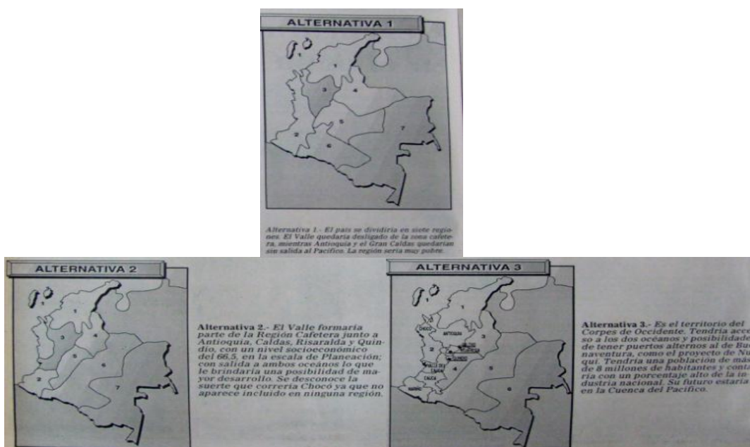
Grafico 2: Alternativas regionales