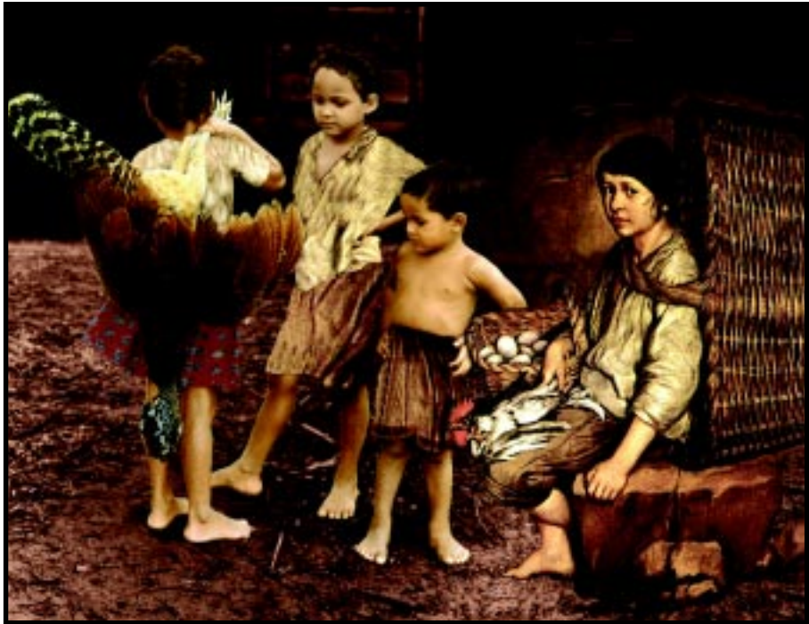
Giacomo Ceruti. Porteador con cesta a la espalda, 1735

Jacobo, ¿ser útil? ¡No! ¡Ser niños!, 2002