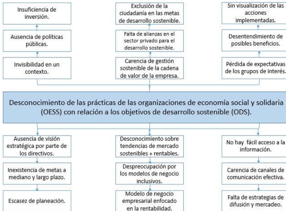
Figura 1: Árbol de problemas. Elaboración propia.

En el presente documento se quieren conocer aquellas prácticas de desarrollo sostenible que una entidad de la economía social y solidaria (Cooperativa) del Valle del Cauca, cumple en sus actividades. De igual manera a través de la investigación teórica se quieren conocer aquellas razones por las cuales desconocen estas prácticas y por lo cual no se llevan a cabo en las entidades.