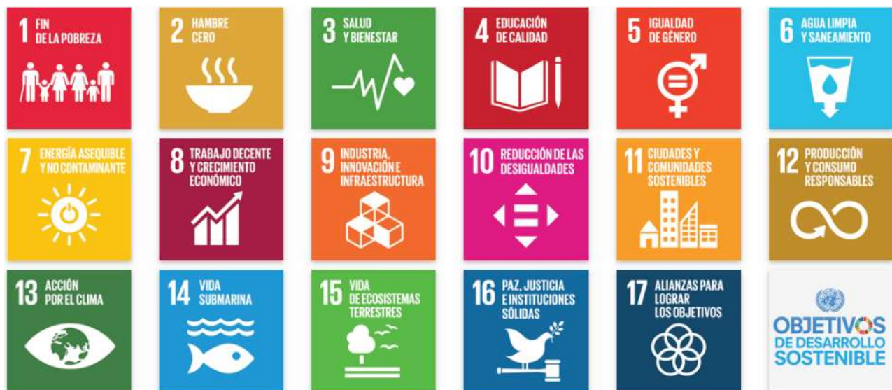
Figura 2. Objetivos de Desarrollo Sostenible. Tomado del Programa de las Naciones Unidas para el Desarrollo.

Los ODS (Objetivos de Desarrollo Sostenible), son 17 objetivos con 169 metas y fueron establecidos por la ONU de la siguiente manera: