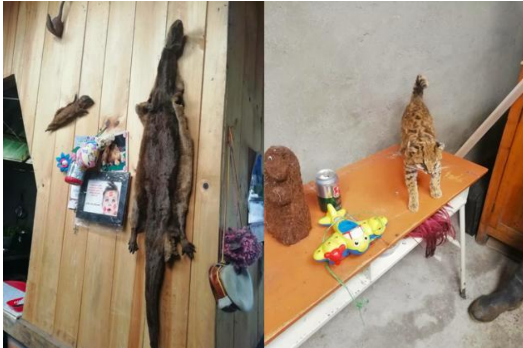
Fotografías tomadas al interior de 2 viviendas de la vereda de Santa Isabel donde se aprecia animales como la comadreja andina (conocida en la región como “Chucur”), la nutria y el tigrillo de monte.

De esta misma manera se identificó un gran deterioro de los ecosistemas por actividades pesqueras y carboneras por ausencia de control administrativo, actividad única para campesinos y falta de educación y/o concientización por parte de los pobladores. La actividad carbonera en gran medida sigue siendo una actividad productiva que persiste en el territorio a pesar de los intentos de las autoridades por disminuir, eliminar y cambiar esta dinámica que tiene grandes impactos en el medio ambiente.