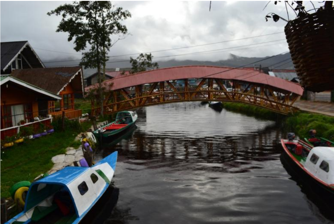
Vereda el puerto

viviendas lacustres que atrae a los turistas y pescadores deportivos por la belleza del paisaje y la pesca de la trucha arcoíris introducida a mediados del siglo XX y que actualmente es el sustento de numerosas familias.