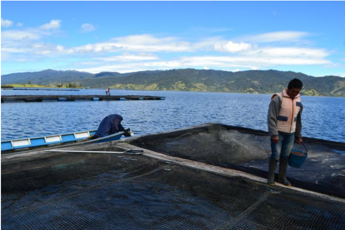
Fotografía tomada en la vereda Santa Teresita – indígena productor de trucha (2019)

La mayoría de las familias obtienen sus ingresos de actividades agropecuarias y extractivas del medio ambiente, explotan recursos directamente asociados a los humedales satisfaciendo medianamente sus necesidades, desarrollando actividades de producción a pequeña escala. Se centran en la explotación agrícola, pecuaria y extractiva de carbón. Según el Plan de Manejo del Humedal (2010), la Laguna de la Cocha se presenta una mala distribución de tierra entre sus habitantes, siendo los terrenos de los nativos menores o iguales a una hectárea “estos factores de tamaño de la propiedad y tenencia de la tierra en el Humedal Laguna de La Cocha, se deben tener en cuenta para definir estrategias y políticas orientadas a potenciar el papel de la pequeña producción agropecuaria en busca de superar las condiciones en las que viven la mayoría de las familias campesinas, ya que uno de los elementos de mayor limitación que posee la zona, es la escasez de tierras disponibles para la actividad agropecuaria y el tamaño de la tenencia de la tierra” Ambiente, Nariño, Pasto, & Corponariño, 2011; pág. 170). Adicionalmente los cultivos tienen bajos rendimientos por área sembrada ya que la longitud de las parcelas y los suelos poco fértiles y quebrados no disponen de vías de acceso convenientes a los mercados y de otras obras de infraestructura, tales como canales de riego y drenajes.