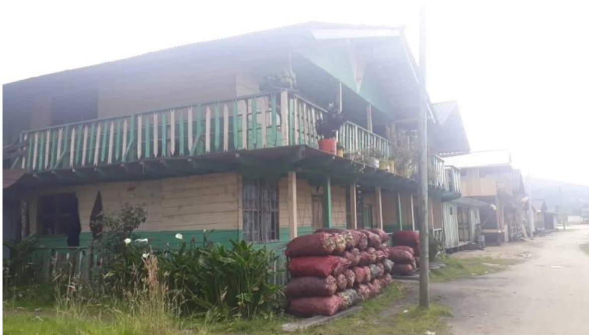
Fotografía tomada en la vereda Santa Lucia (2019)