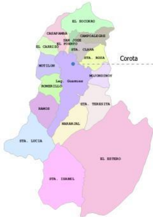
Mapa de El corregimiento de El Encano

La Laguna, es el segundo cuerpo de agua natural más grande del país mide 4.240 hectáreas, 40 km 2 y una longitud de 25 km. Tiene una profundidad máxima de 70 metros de aguas transparentes y de bellos contornos, la cual se puede recorrer en lancha desde el pueblo de El Encano (Ambiente, Nariño, Pasto, & Corponariño, 2011; Plan de Manejo integral del Humedal Ramsar Laguna de la Cocha, 2011). En el año 2000, mediante el Decreto 698 del 18 de abril, Colombia inscribió a la laguna de La Cocha o lago Guamuéz como humedal 8 de importancia internacional dentro del convenio Ramsar 9 , siendo el primero con esta calificación en la zona andina. En el centro, posee una isla llamada La Corota que alberga un santuario de Flora y Fauna bajo el cuidado del sistema de Parques Nacionales. En ella se encuentra el hogar de numerosas aves y plantas, muchas de ellas endémicas. Alrededor del lago existe varias reservas naturales de carácter privado, al cuidado de habitantes de la región. Las poblaciones asentadas a su alrededor son pescadores y agricultores, campesinos y descendientes de antiguas culturas Quillacingas, que la consideran un lugar sagrado. De las comunidades asentadas en sus orillas la principal es la vereda de El Puerto, característica por sus