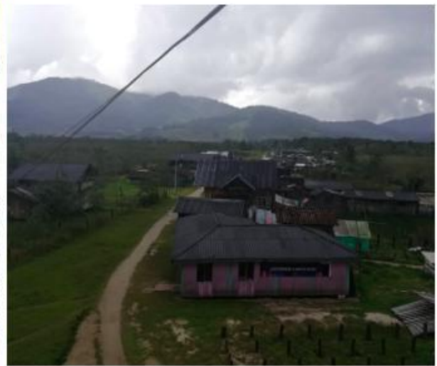
Fotografías tomadas de las veredas Santa Tercecita y Santa Lucía (2019)