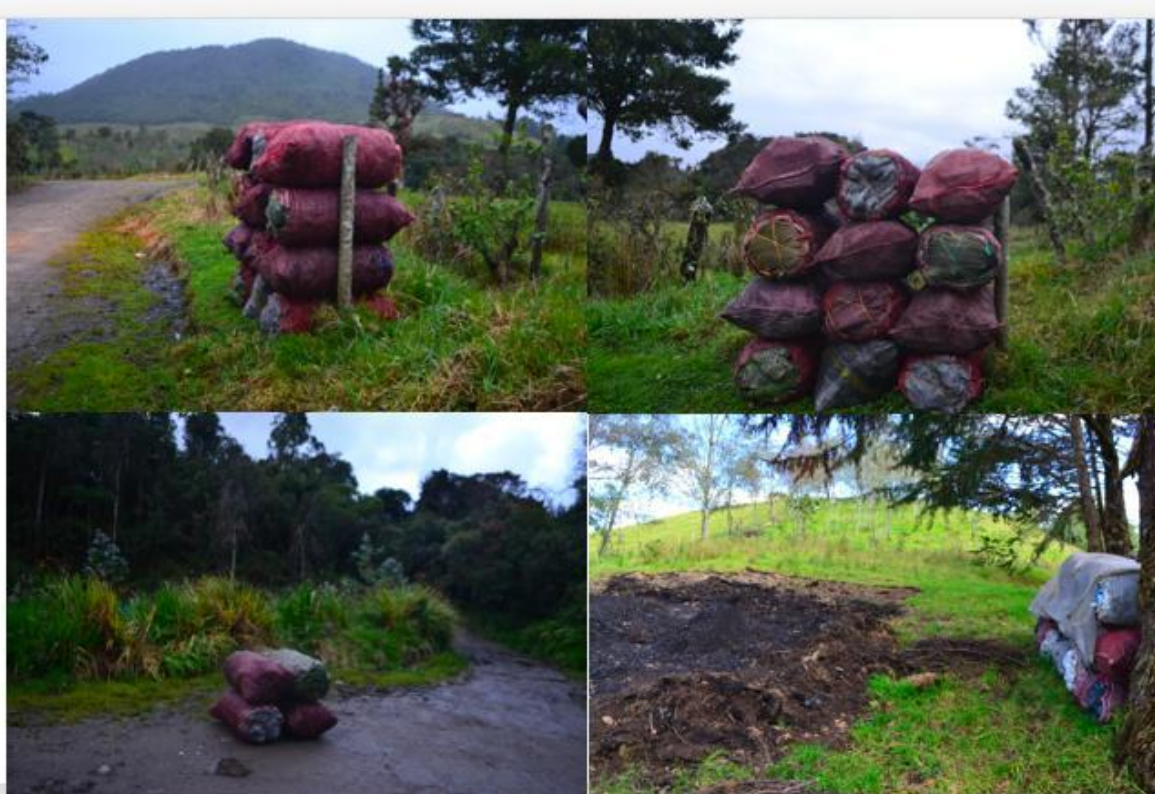
Fotografías tomadas en las veredas Santa Teresita, Santa Lucia y Santa Isabel (2019)