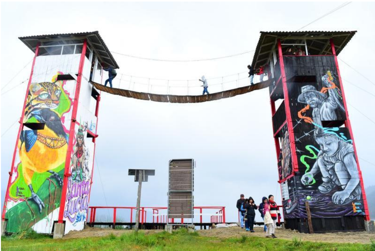
“Torres de Paz” actuales y restructuradas torres de Santa Lucía