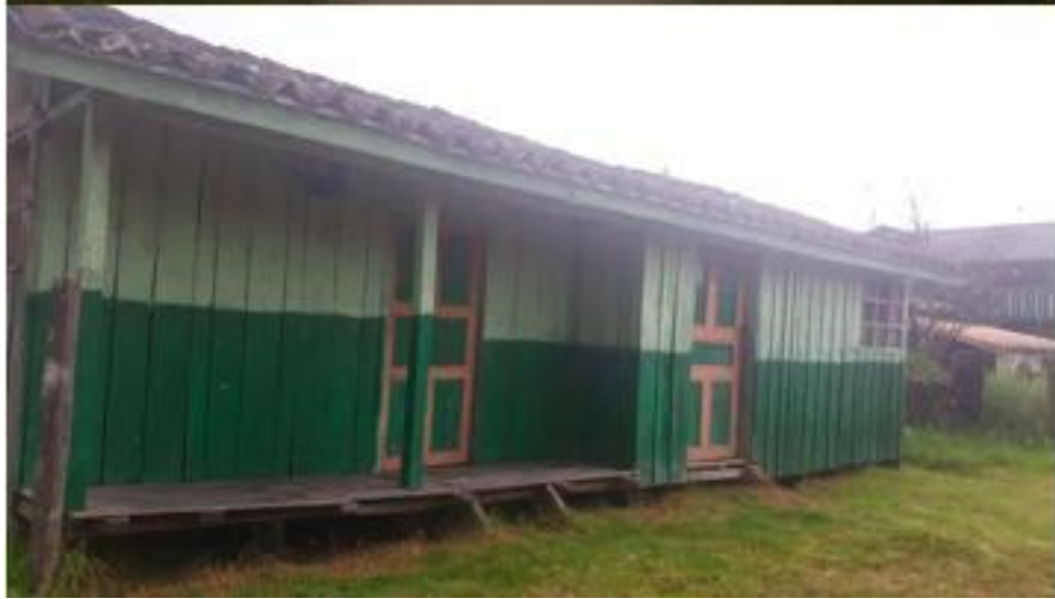
Fotografías tomadas en la vereda Santa Lucía (2019)

Lo anterior es también descrito en el Plan de Manejo de La Laguna de la Cocha (2010), en donde se resalta la baja estratificación y malas condiciones en las que el estrato 0 representa el 26% de la población (1851 personas) seguido por estrato 1, 2 y 3 alberga a la mayoría de la población. Así también, se menciona que el NBI para el humedal es del 17% (Plan de Manejo de La Laguna de la Cocha, 2010; pág. 195).