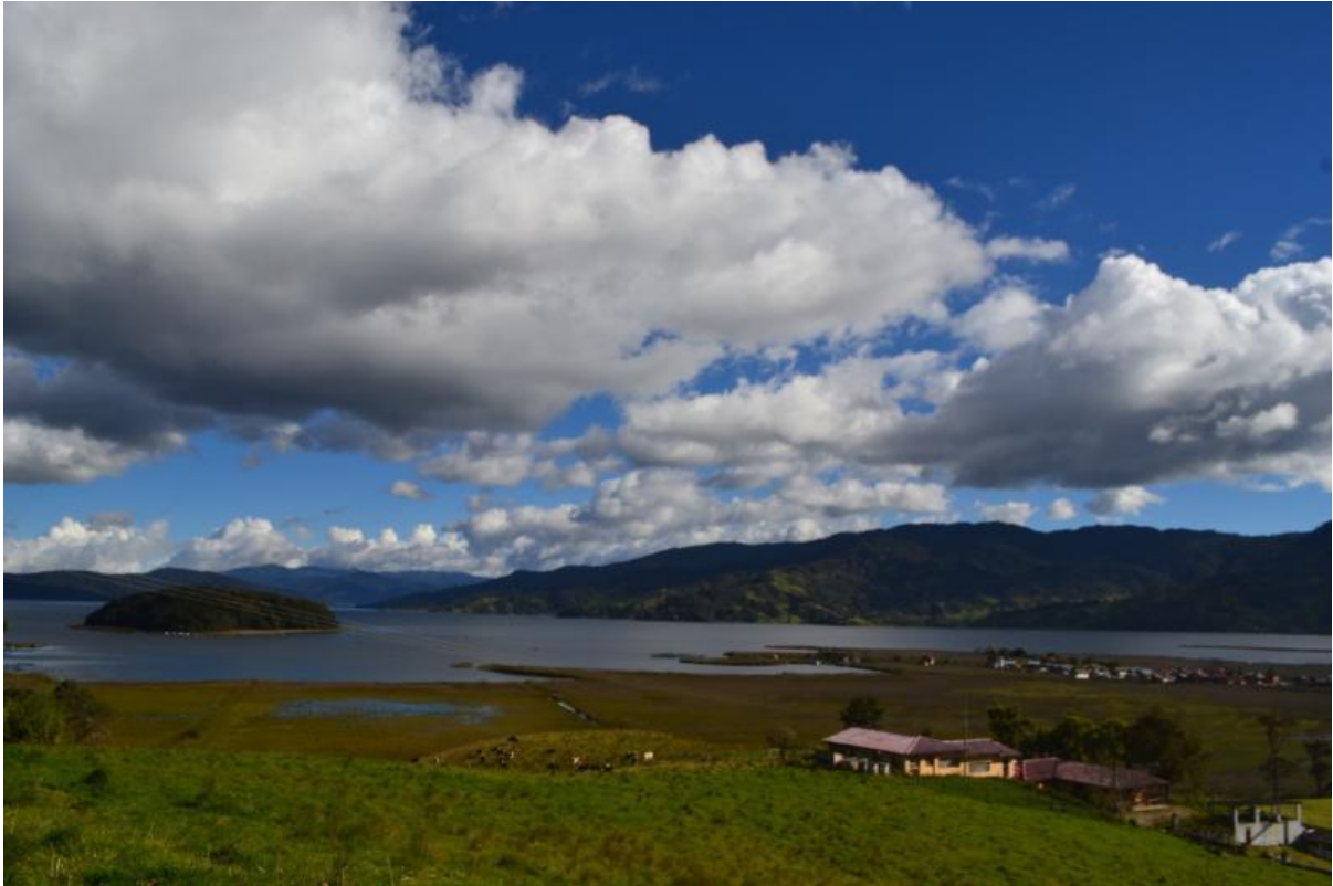
Panorámica Laguna de la Cocha