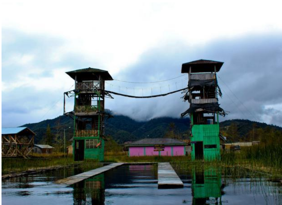
Antiguas torres de Santa Lucía