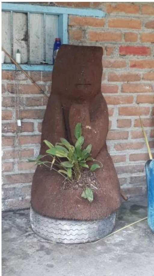
Fotografía escultura oso de anteojos, vereda Santa Isabel