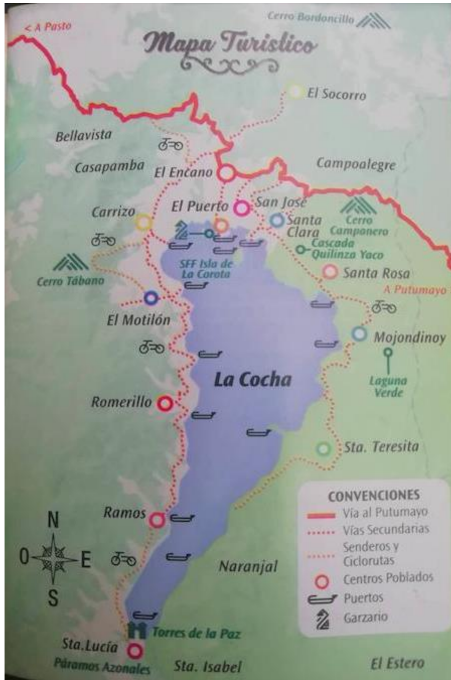
Imagen tomada del Follero turístico "Pasaporte La Cocha - Santuario de Flora, Fauna y Paz"; Alcaldía de Pasto (2018)

El sistema económico rural se basa en actividades agropecuarias y extractivas, oferta y demanda de bienes y servicios del medio ambiente (236 predios, con un área total de 807,4052 hectáreas), explotación agrícola, pecuaria, piscícola 13 y extractiva con la producción de carbón 14 , asociadas a la actividad comercial y de transporte y actividades secundarias como transporte, comercio y turismo. Estas interactúan en el sistema socioeconómico que involucra factores como el crédito, el mercado,