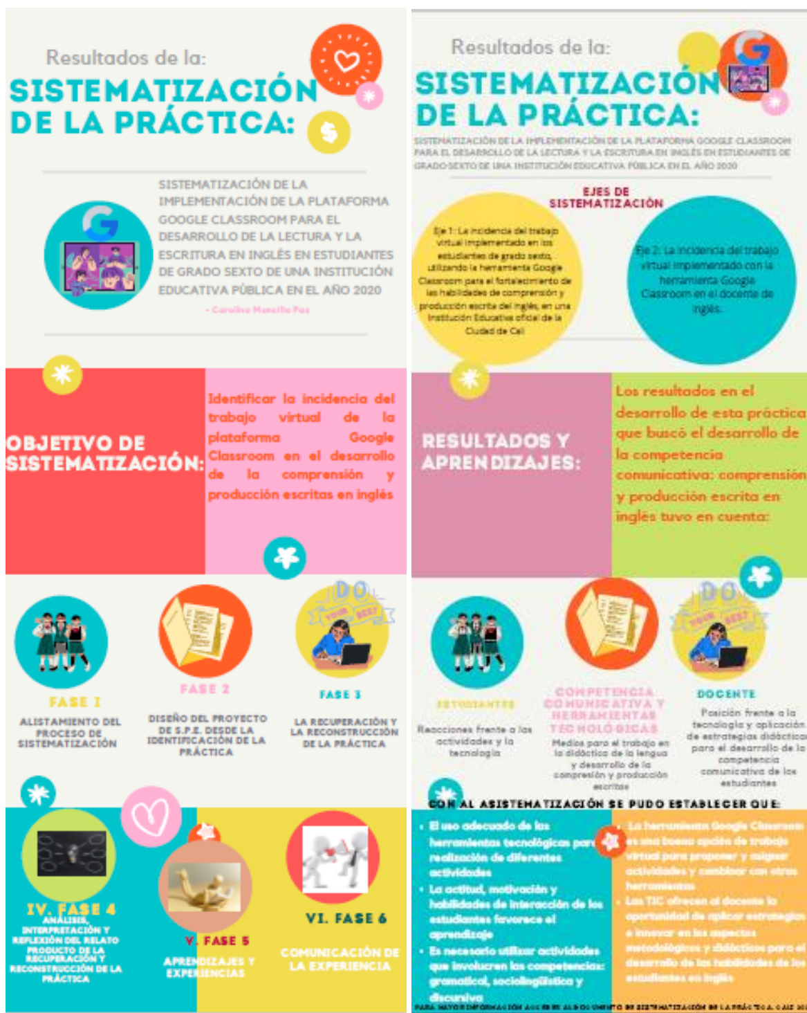
Imagen 3. Infografía