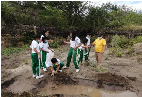
Extrayendo el material de la mina