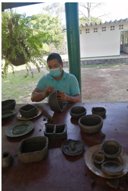
Proceso de alisado

amablemente se ofreció a hornear nuestras piezas cuando sea el momento. Es preciso indicar que cada momento transcurrido en las sesiones fue documentada en videos y fotografías, las cuales serán el insumo para el diseño de la página web que será el producto de nuestro trabajo, y la forma de dar a conocer al mundo entero la historia de la alfarería de nuestra vereda, sus artesanos, sus productos y el proceso de elaboración de las artesanías de la vereda Vega de Oriente del municipio de Campoalegre Huila.