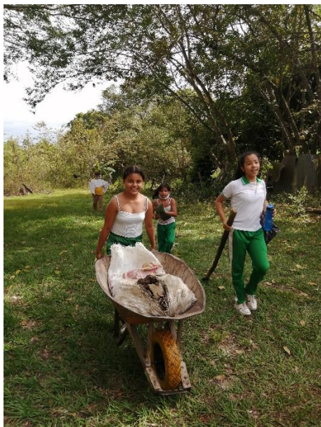
Regresando con el material extraído