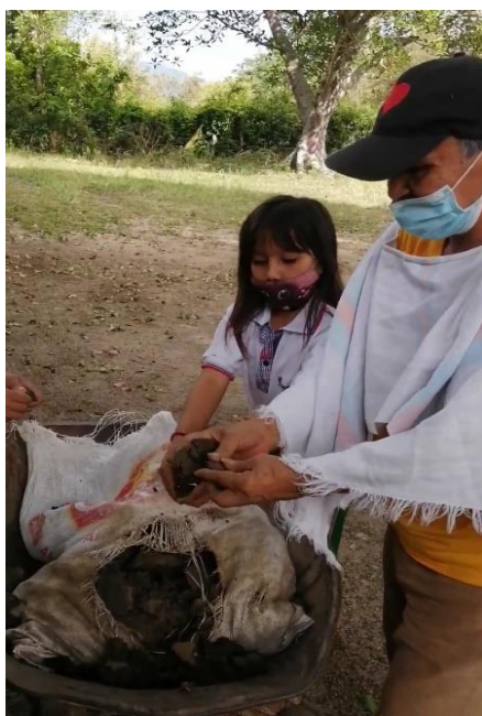
Aprendiendo a desmenuzar