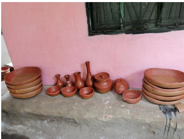
Figura 7. Evidencias de los resultados