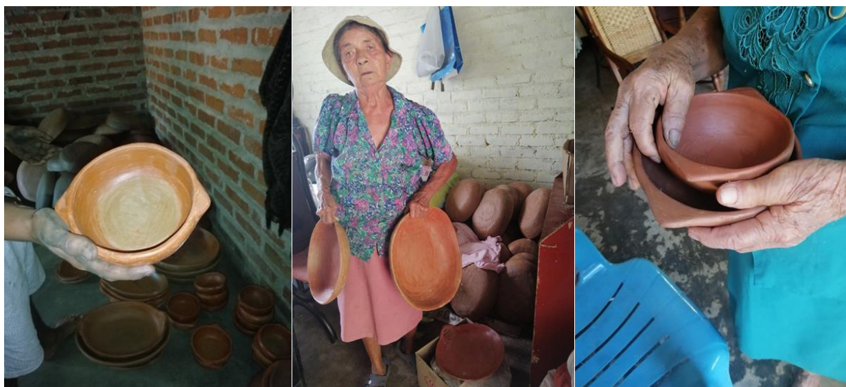
Figura 8. Evidencias de la investigación