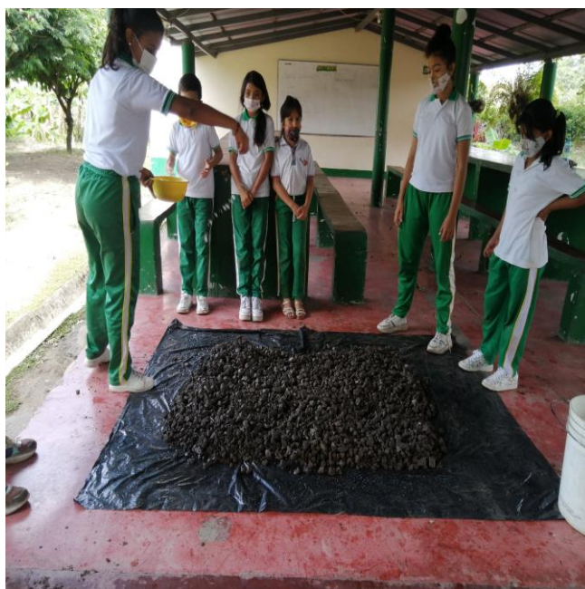
Remojando la arcilla