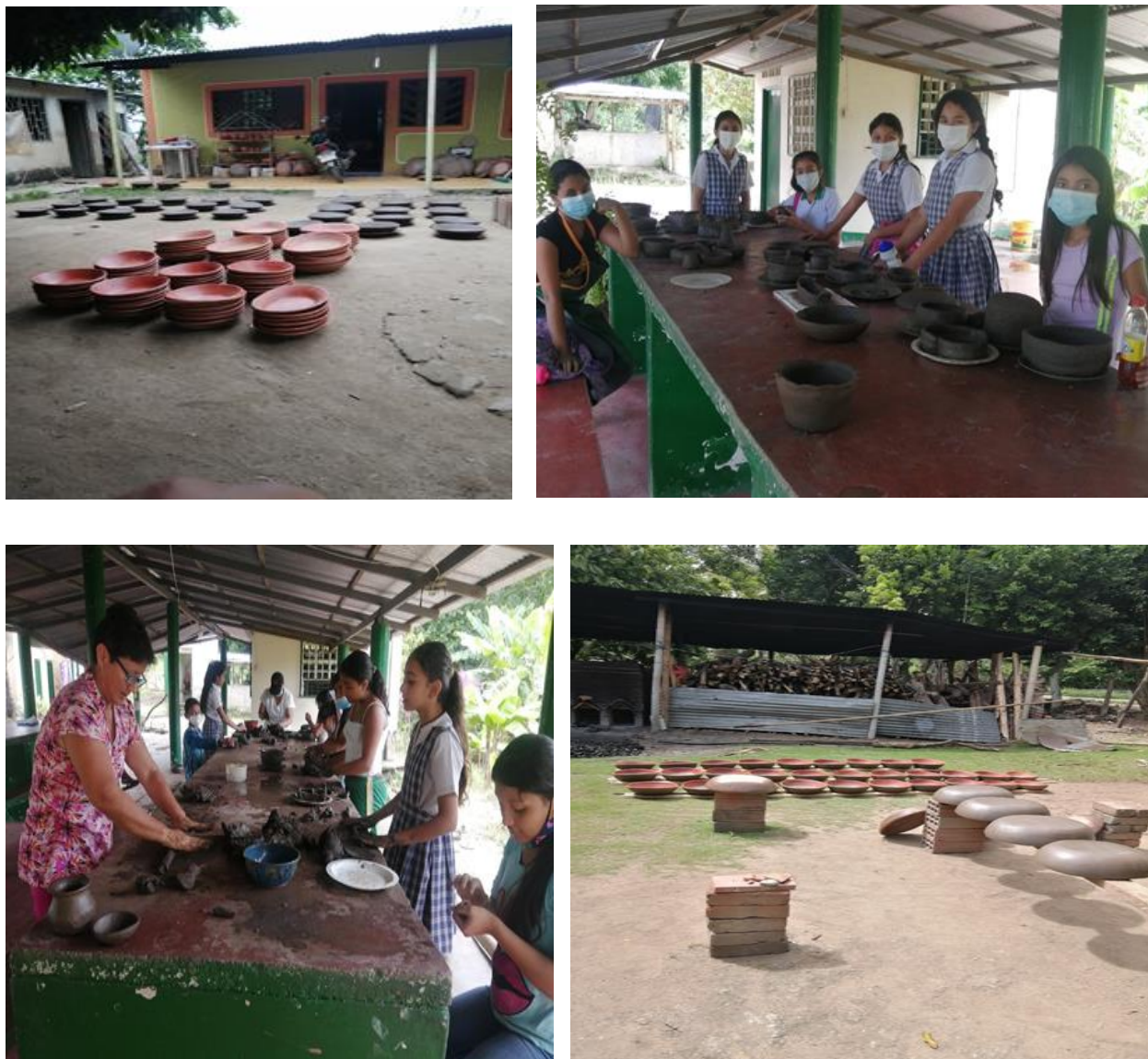
Figura 6. Evidencias