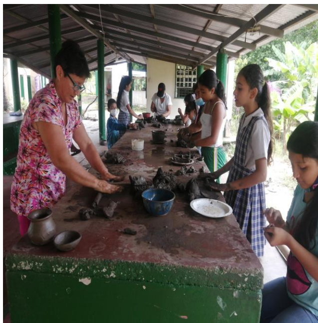
proceso de moldeado