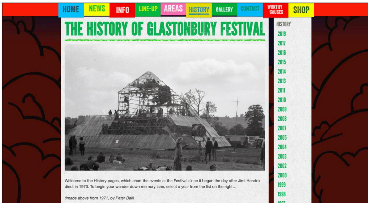
Figura 4. Glastonbury Festival

Por último, traigo el diseño de la historia del Glastonbury Festival en su página web (Figura 4.) pues, su presentación es similar a la del Rainforest World Music Festival al presentar las memorias multimediales por años, pero a diferencia del anterior, este presenta una breve reflexión de sus memorias y además, las enseña desde el momento de su creación.