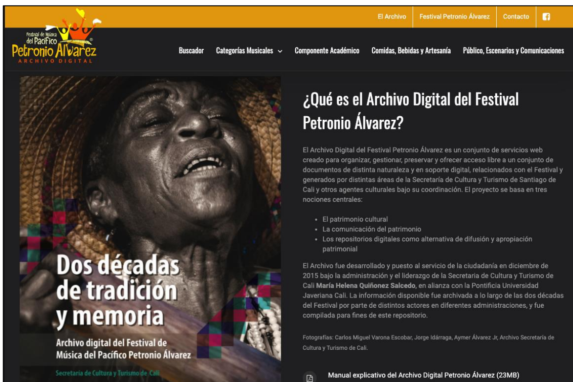
Figura 3. Festival Petronio Álvarez

En tercer lugar, se ubica el Petronio (Figura 3.) y su archivo, un ejemplo especial en el sentido de que es el más cercano al contexto del Festival Bandola por llevarse a cabo en el mismo departamento, aunque su composición es diferente. Este evento resalta la identidad cultural de la región pacífica colombiana desde una perspectiva artística, gastronómica, artesanal y académica. Tal cual se encuentran en su archivo las perspectivas mencionadas.