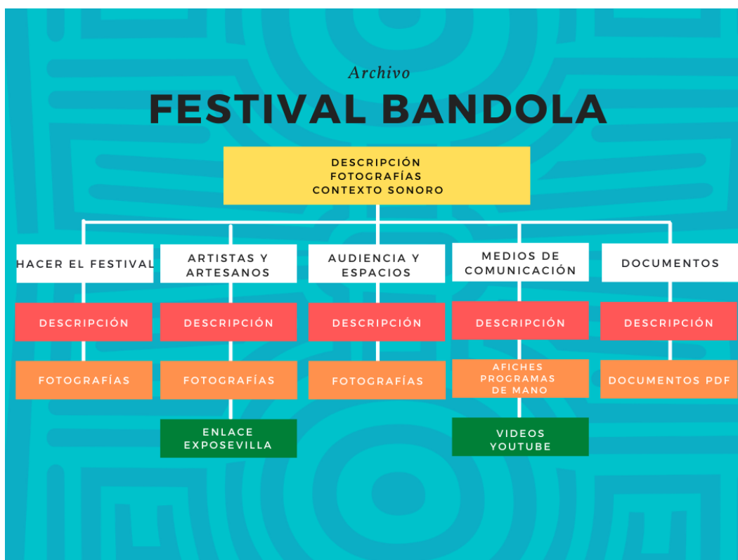
Figura 7. Estructura del proyecto multimedia

En esta sección se presentan los componentes del producto final, específicamente, el proyecto multimedia Archivo Digital Bandola, que puede consultarse AQUÍ . La siguiente es la estructura del proyecto multimedia: