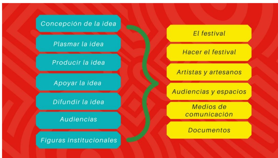
Figura 6. Esquema propuesto para el archivo digital