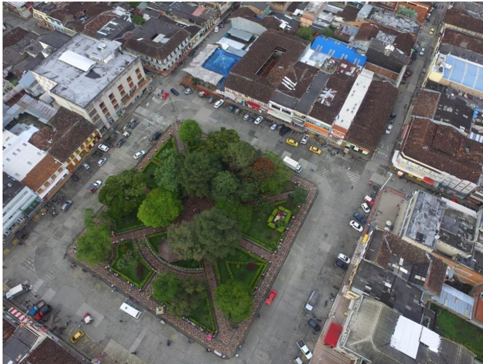
Figura 8. Plaza de la concordia

En esta sección, los documentos resaltan que hay instituciones de orden público y privado interesadas en nombrar y ser parte del festival por intereses de variada índole. Se hace relevante pensar en ¿qué tienen que ver lo anterior, con la forma de administrar el espacio central, es decir, la plaza de la concordia? Como vemos en la figura 8, en la esquina superior derecha se coloca la tarima principal. Por medio de un rastreo de imágenes o en la presencialidad, eventualmente ¿cómo se pueden observar los patrocinios en el espacio público? ¿Qué quiere decir que los dummies de los patrocinios habiten en ubicaciones estratégicas? ¿Cómo perciben las instituciones el manejo de los recursos suministrados como publicidad?