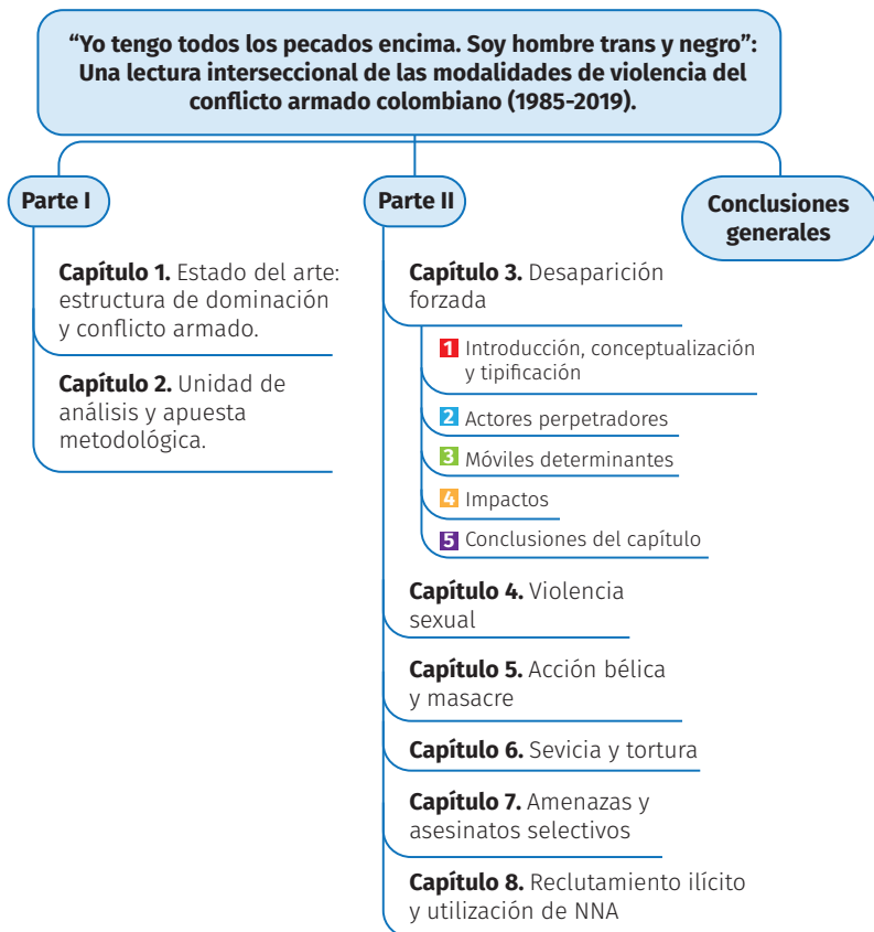
Figura 1. Estructura del texto