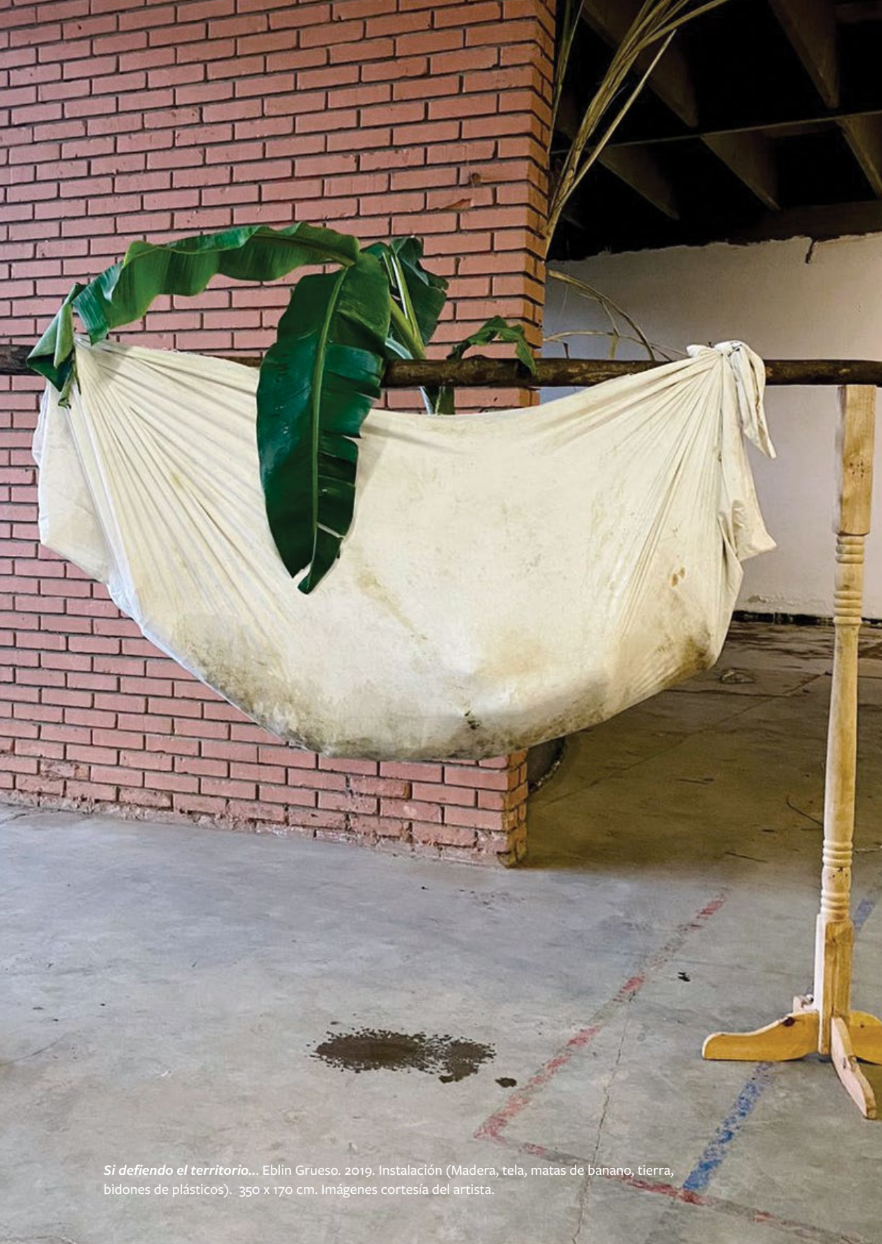
Si definiendo el territorio... Eblin Grueso. 2019. Instalación (Madera, tela, matas de banano, tierra, bidones de plásticos). 350 x 170 cm.