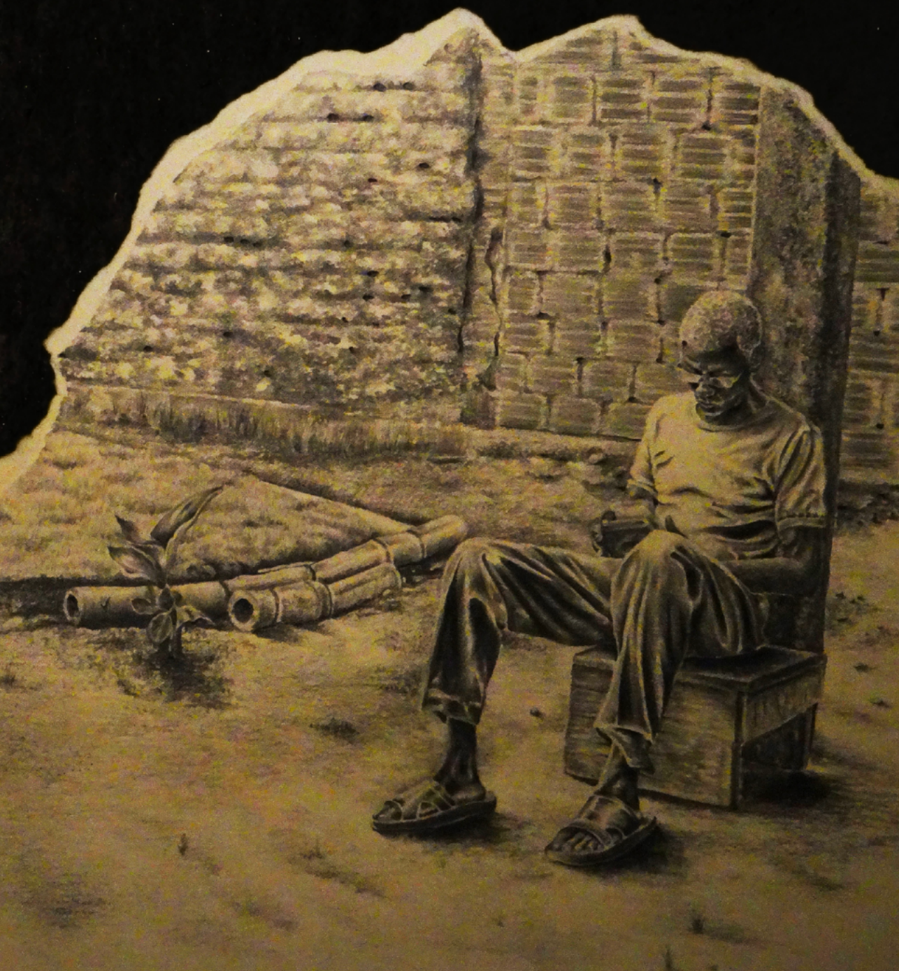
Los más grandes . Romario Paz. 2020. Serie Paisajes Vacíos. Dibujo sobrepuesto en grafito y carboncillo sobre papel rasgado. 50 x 40 cm.