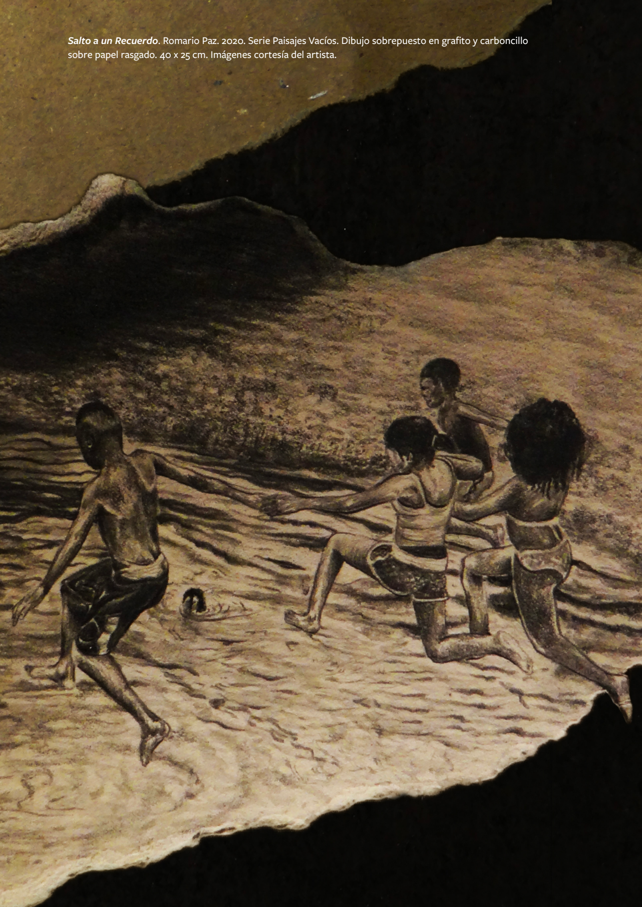
Salto a un Recuerdo . Romario Paz. 2020. Serie Paisajes Vacíos. Dibujo sobrepuesto en grafito y carboncillo sobre papel rasgado. 40 x 25 cm.