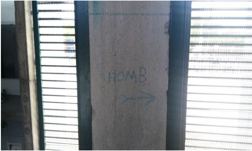
(Fotografía N° 6. Terminal de Calipso Julio Rincón. 22 de julio de 2015)