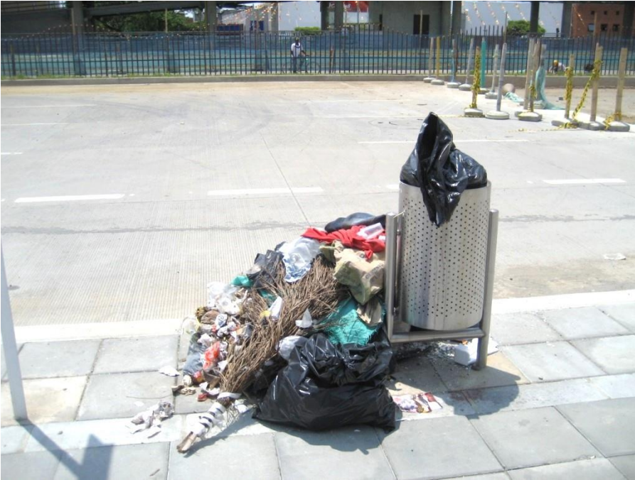
(Fotografía N° 20). Canal de aguas residuales al frente de Terminal Calipso Julio Rincón, costado oriental. 24 de agosto de 2015)