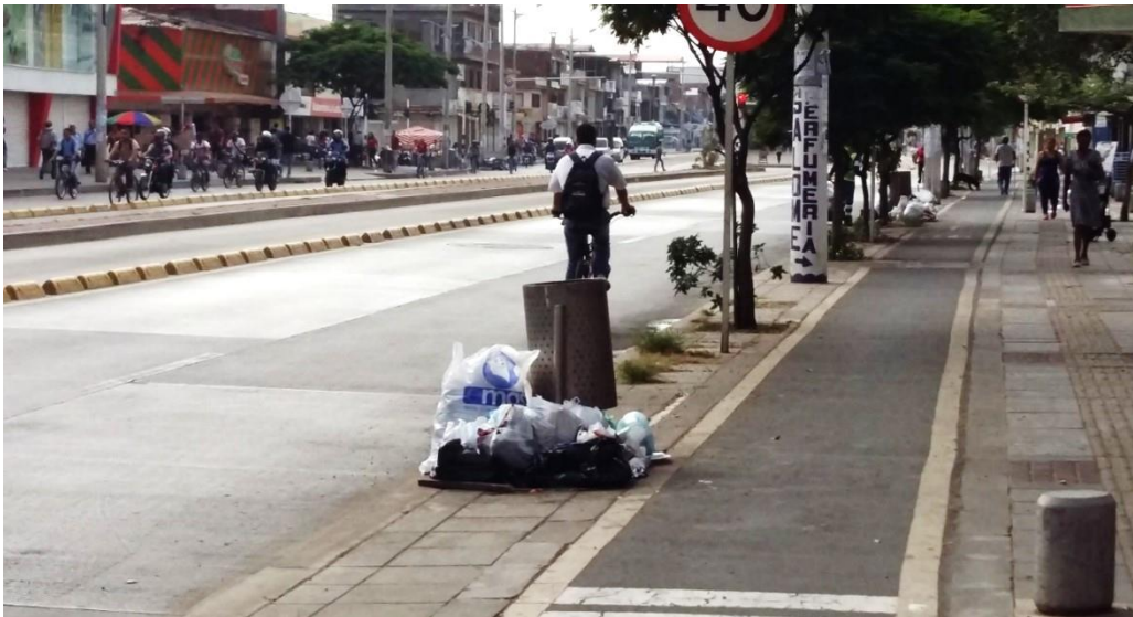
(Fotografía N° 23). Ciclo-ruta Troncal de Agua Blanca con carrera 28. Tomada por Luis Ernesto Valencia Angulo, 24 de agosto de 2015)