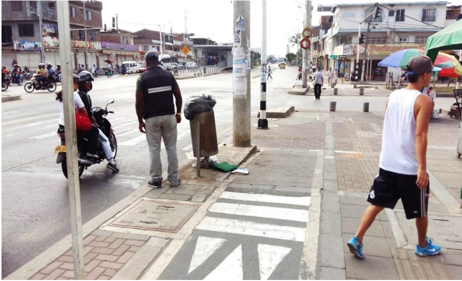
(Fotografía N° 24). Ciclo-ruta carrera 100 al frente de la Universidad del Valle. Tomada por Lixis Castillo, 28 de agosto de 2015)