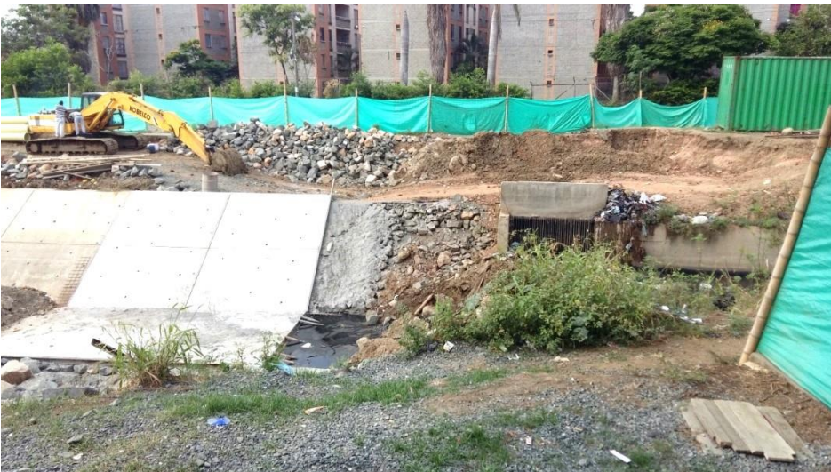
(Fotografía N° 21). Canal de aguas residuales al frente de Terminal Calipso Julio Rincón, costado oriental. 24 de agosto de 2015).