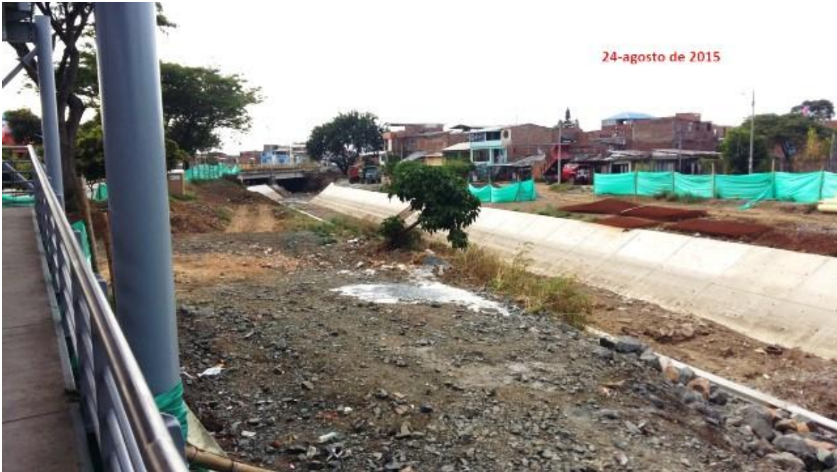
(Fotografía N° 22). Ciclo-ruta Troncal de Agua Blanca con carrera 28. Tomada por Luis Ernesto Valencia Angulo, 24 de agosto de 2015)