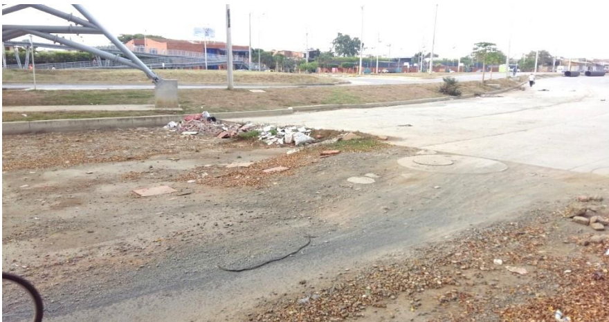
(Fotografía N° 11. Avenida Simón Bolívar, al frente de la Terminal de Calipso Julio Rincón, costado occidental. Tomada por Lixis Castillo, 24 de agosto de 2015)