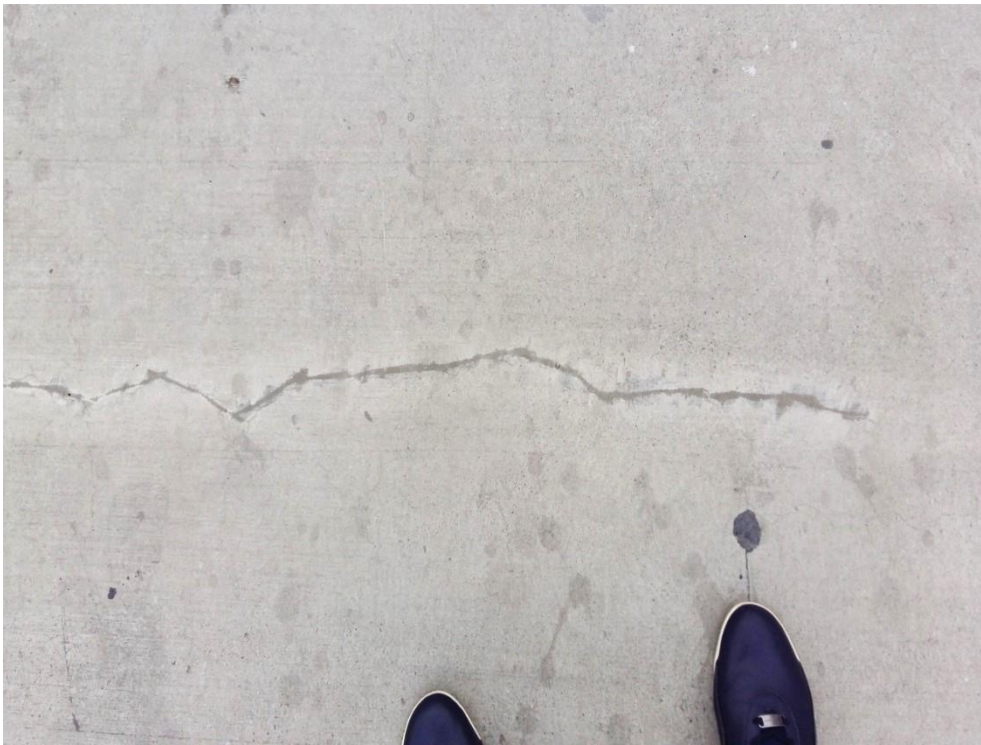
(Fotografía N° 16. Avenida Simón Bolívar, al frente de la Terminal Calipso Julio Rincón, 22 de julio de 2015)