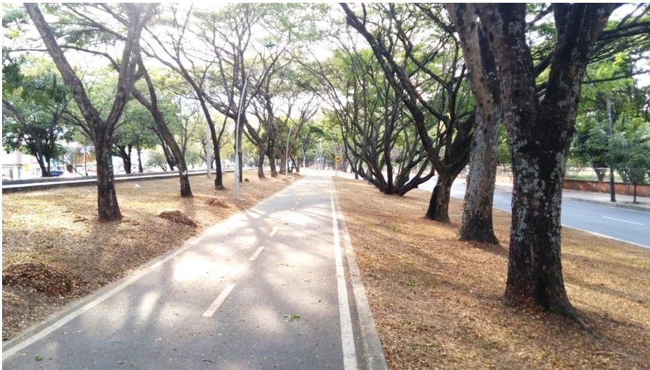
(Fotografía N° 25). Ciclo-ruta carrera Calle 13 (Pasoancho) al frente de la Universidad del Valle. 28 de agosto de 2015)