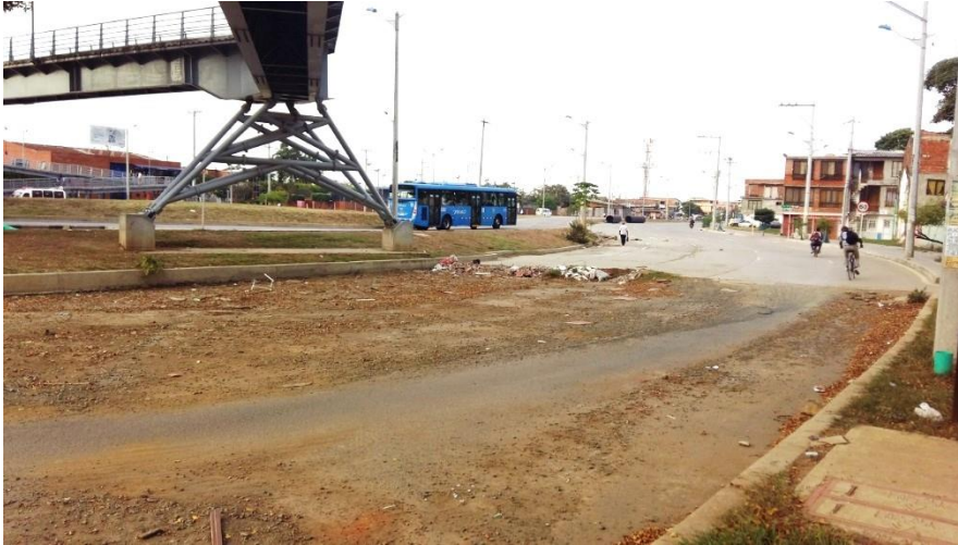
Fotografía N° 10. Avenida Simón Bolívar, diagonal de la Terminal de Calipso Julio Rincón, costado occidental. 24 de agosto de 2015)