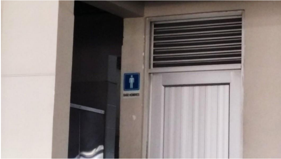
(Fotografía N° 8. Avenida Simón Bolívar, diagonal Terminal de Calipso Julio Rincón, costado occidental. Tomada por Lixis Castillo, 24 de agosto de 2015)