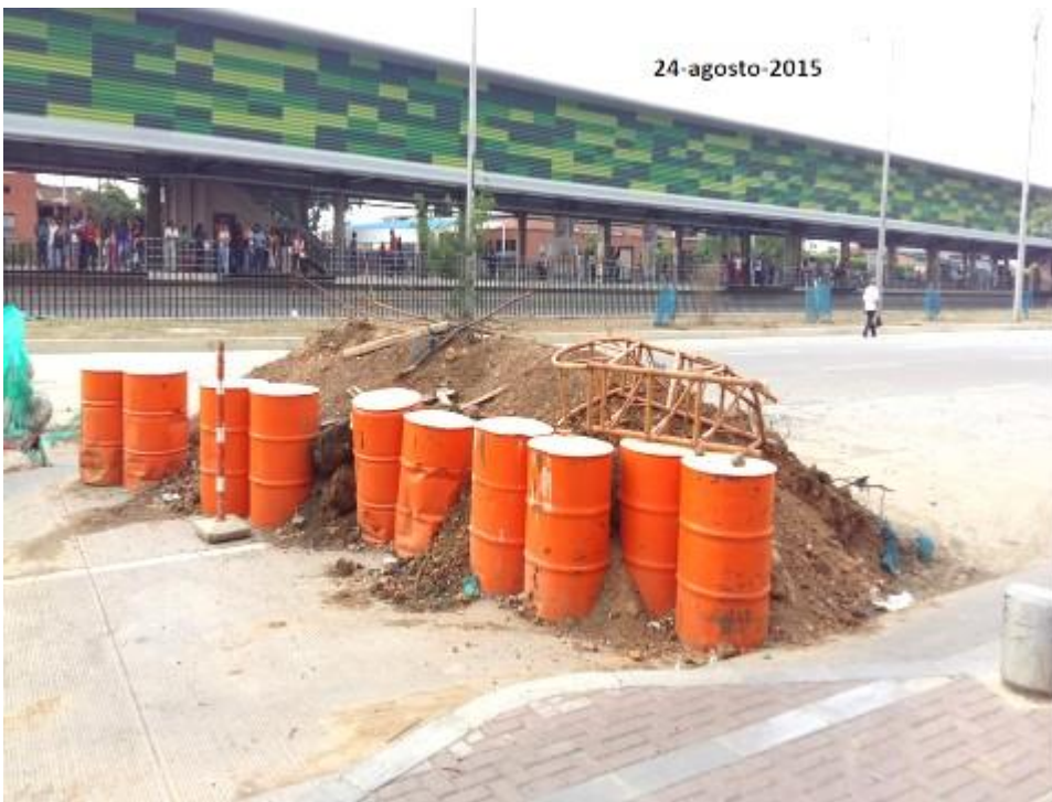
(Fotografía N° 13. Terminal de Calipso Julio Rincón. 28 de agosto de 2015)