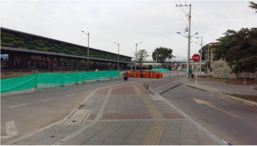
(Fotografía N° 12. Avenida Simón Bolívar, al frente de la Terminal de Calipso Julio Rincón, costado occidental. 24 de agosto de 2015)