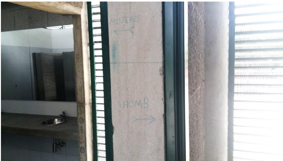
(Fotografía N° 7. Terminal Unidad deportiva. Tomada por Luis Ernesto valencia, 31 de agosto de 2015)