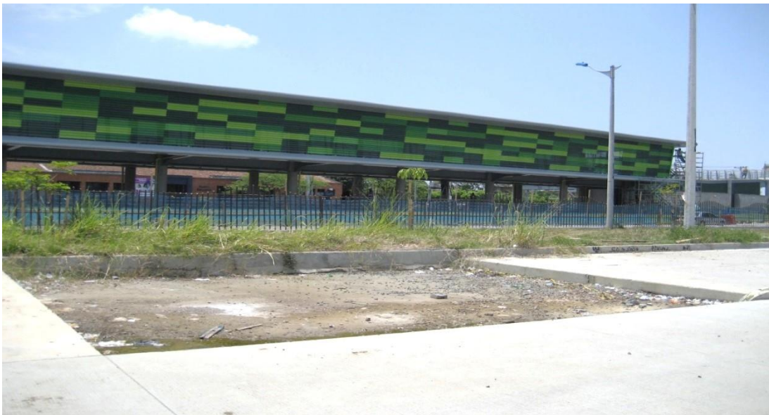
(Fotografía N° 9. Avenida Simón Bolívar, al frente de la Terminal de Calipso Julio Rincón, costado occidental. Tomada por Luis Ernesto Valencia Angulo, 22 de julio de 2015).