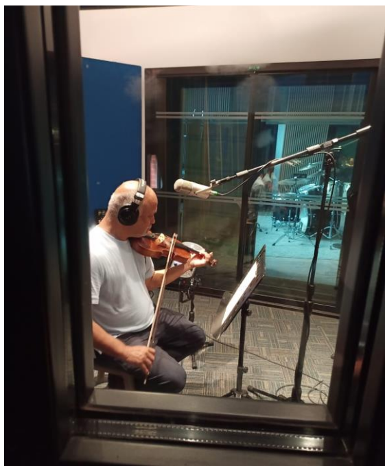
Imagen 181. Pescador, J (2024). Fotografía grabación de violín.