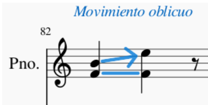
Imagen 6. Pescador, J (2024). Ilustración de movimiento oblicuo.

Una de las características de estos arreglos vocales, es el termino de, movimiento oblicuo, suele utilizarse para describir una línea musical que se mueve en dirección diagonal u oblicua, en lugar de mover directa o paralelamente. Puede desempeñar un rol en otros elementos musicales, como en el ritmo o la armonía, ya que, genera una sensación de movimiento hacia adelante, de alguna manera tensiona con energía para llegar a su punto de reposo.