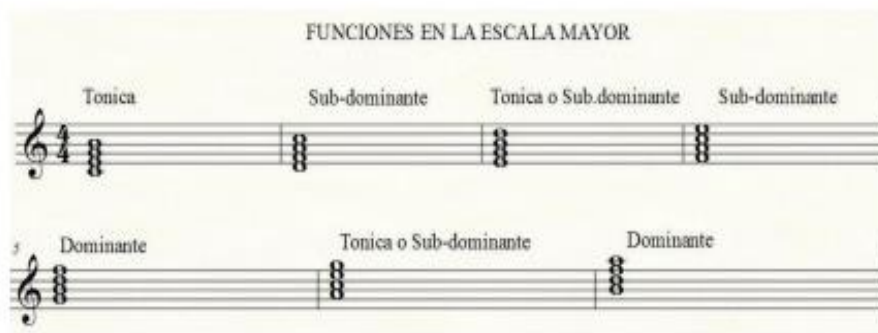
Imagen 12. Salazar, G (2023). Sustituciones funcionales.

Ahora, para brindar un color distinto desde la armonía suele hacerse uso de, las sustituciones funcionales, las cuales pueden incluir cosas como usar una armonía diferente en lugar de un acorde tónico o dominante, o usar un acorde diferente en lugar de otro acorde que normalmente ocurriría en una progresión específica. Dicha técnica se usa con frecuencia en el jazz y otras formas de música donde prima la improvisación, así como en otros géneros, para agregar interés armónico y complejidad a una pieza musical (Gabis, 2006; Herrera, 2022).