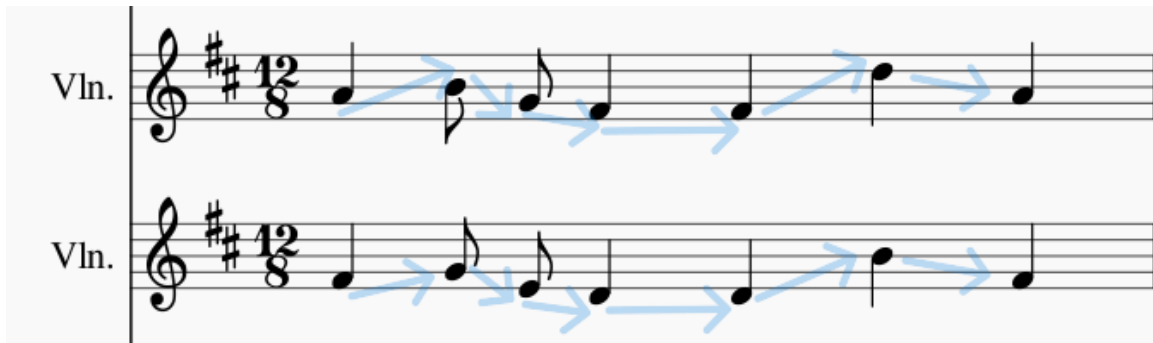
Imagen 7. Pescador, J (2024). Ilustración de movimiento paralelo.

También, La apoyatura es un recurso, concepto musical que se refiere a una nota no armónica que se anticipa a una nota principal, creando un efecto tensionante, pero ligero, que resuelve cuando se toca la nota a la que se dirige. Generalmente, la apoyatura se ejecuta de forma breve y suele ser un paso hacia una nota que forma parte del acorde en el que se encuentra. En géneros contemporáneos, como el jazz y el folk, también se emplea esta técnica para dar matices y dinamismo a la interpretación, exponiendo la versatilidad y el impacto emocional que puede tener en la música. En la imagen cuatro, en el segundo recuadro negro, logra verse la nota agregada justo antes de caer en sincopa a la nota del acorde.