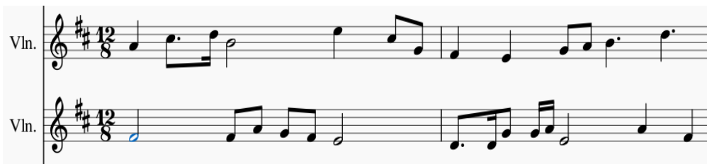
Imagen 10. Pescador, J (2024). Ejemplo de contramelodía.

Este recurso es característico en diversos géneros musicales, desde la música clásica, hasta el jazz y el pop, donde la interacción entre la línea melódica principal y la contramelodía pueden provocar momentos de gran belleza y emoción.