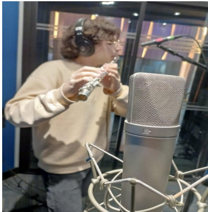
Imagen 21. Pescador, J (2024). Fotografía grabación de la flauta travesa.