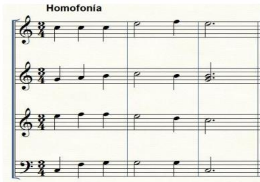
Imagen 9. Salazar, G (2024). Homofonía.

La homofonía, es otro rasgo distintivo en este género, y claramente aplicado en diversos más. Es cuando varias voces o instrumentos interpretan la misma melodía a un mismo tiempo, pero con diferentes acordes, líneas melódicas o armonías. En el formato coral, donde varias voces cantan la melodía, pero en diferentes tonos, provocando una sensación de complejidad y profundidad.