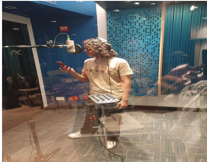
Imagen 22. Pescador, J (2024). Fotografía grabación de voz líder.

Para grabar este instrumento se utilizaron 3 micrófonos, dos de ellos en técnica estéreo para capturar los golpes al parche y el tercero se posiciona debajo de los pies del músico apuntando a la apertura hueca del instrumento para capturar el low end del mismo.