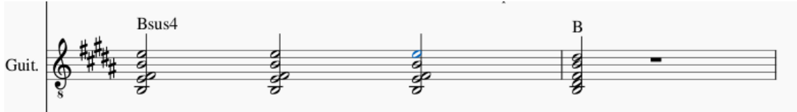
Imagen 16. Pescador, J (2024). Fragmento de la armonía del verso del Hito 2.

Antes de cerrar con esta sección, es importante resaltar que la revisión del ritmo armónico-melódico de los temas escogidos de Dylan, son ejemplos dignos de lo que, hasta ese momento, eran las composiciones o interpretaciones de clásicos temas de folk. Posteriormente empezó a expandirse, este género, tanto musicalmente como geográficamente, es decir, empezó a ser combinado con el folk y generar impacto de diferente manera en otras partes del mundo, como Sudamérica.