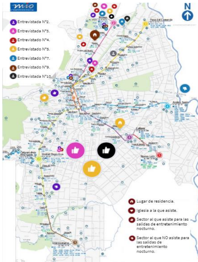
Ilustración 2 Cartografía de Cali

permea, les dice que no hay caleñidad sin fiesta y que siempre hay lugar para que sus valores tomen presencia al lugar que asistan. Es por esta razón que, analizar los lugares de concurrencia de los jóvenes participantes a ciertos lugares brinda no solo información sobre la forma en que habitan la ciudad, sino también la perspectiva que estos tienen sobre los espacios de fiesta y disfrute en la capital vallecaucana. Al igual que en Bogotá, el tamaño de la ciudad también dibuja una ruta de cercanía, pero lo fundamental para elegir o no, asistir a un “rumbeadero” es la música que allí suene; pues como bien dice Ulloa (1988) en Cali la cultura musical hace parte de la identidad caleña, pues esta es la que delimita el grupo de pertenencia, las raíces de proveniencia y, en especial, la cultura que cada sujeto sienta propia a su individualidad.