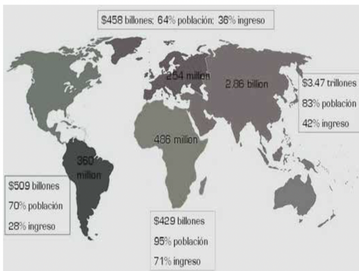
Figura 1. Distribución mundial de la BdP

segmento de la población, con el objetivo de facilitar su acceso a soluciones que satisfagan sus necesidades básicas y mejoren su calidad de vida.