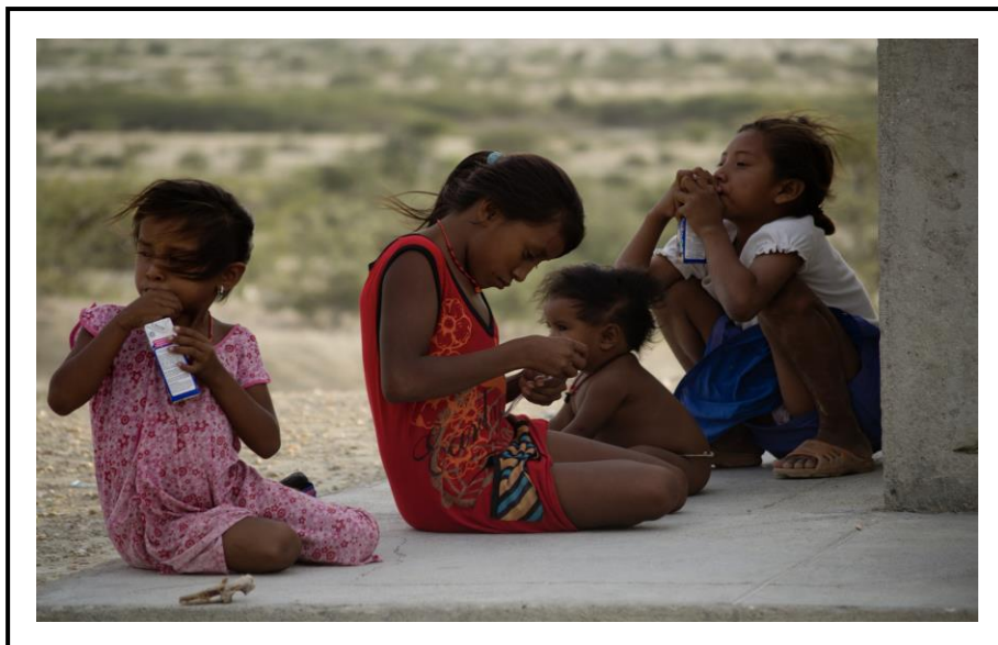
Ilustración N° 08 – Niños Indígenas recibiendo Bebida Láctea - UNESCO