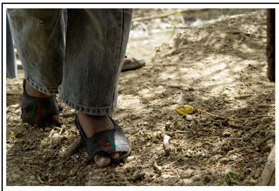
Ilustración N° 05 – Cosmovisión y Cotidianidad Indígena

Por lo que este tipo de inquietudes nos invita a repensar el alcance de la cooperación frente a la real necesidad que las comunidades indígenas interpretan y asumen dentro de lo que entendemos por participación social, aspecto que es determinante frente a como estas minorías han asumido la realidad cultural que