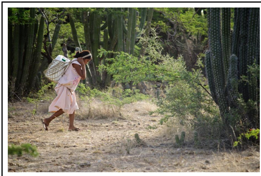
Ilustración N° 06 – Mujer Indígena Recolectando Agua

En este orden de ideas, los planteamientos manifiestos por los entrevistados, comulgan en considerar que preexiste un gran sesgo de información y