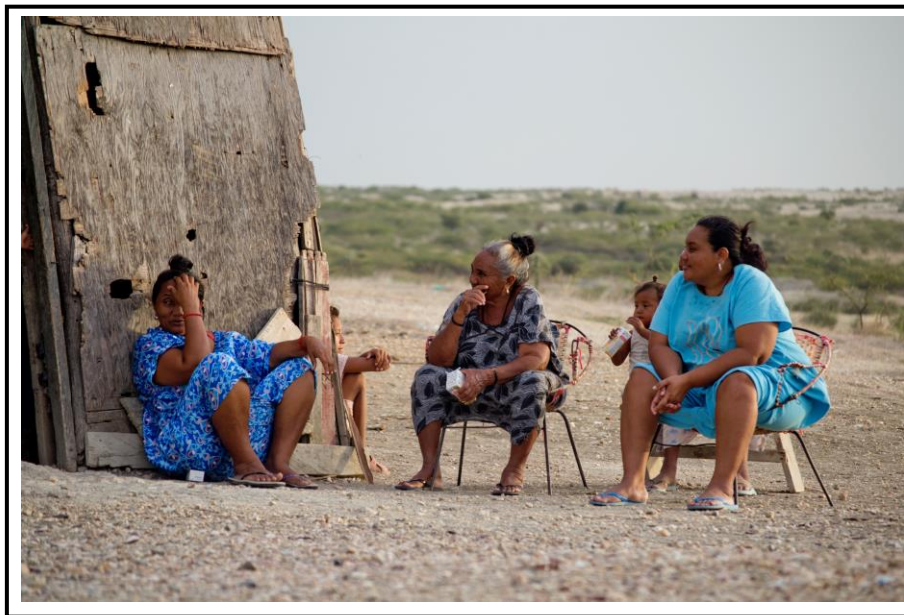
Ilustración N° 04 – Mujeres Indígenas Wayuu

A partir de este programa, la Corporación ha articulado una serie de acciones que se derivan del mismo; a saber: