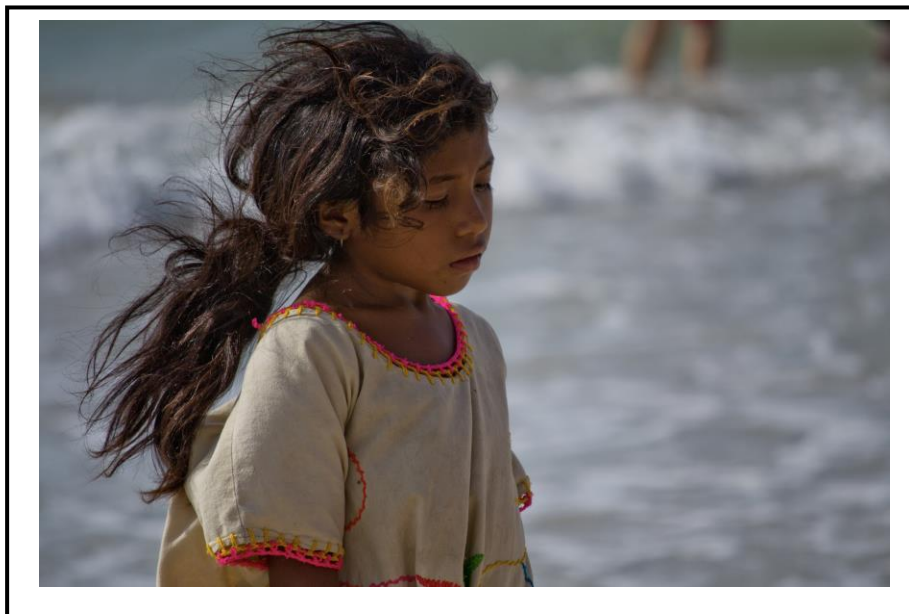
Ilustración N° 07 – Niña Indígena Recolectando Conchas Marinas

Frente a estas percepciones se puede inferir que los pueblos indígenas Wayuu han sido ajenos de los procesos y acciones que se han implementado en sus territorios, tanto los que han obedecido a intenciones humanitarias positivas en procura de su resguardo o protección, como indudablemente a aquellas que les han sido impuestas de manera violenta y que obedecen a intereses exógenos e ilegales.