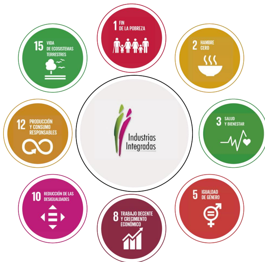
Figura 3: ODS detectados en Industrias Integradas.

Finalmente, tal como se muestra en la figura 3, se lograron identificar ocho ODS en Industrias Integradas: fin de la pobreza, hambre cero, salud y bienestar, igualdad de género, trabajo decente y crecimiento económico, reducción de las desigualdades, producción y consumo responsable y vida de ecosistemas terrestres. Cabe mencionar que, pese a que el gerente de esta cooperativa válida que algunos de sus procesos están alineados al ODS 12 y 15, producción y consumo responsable y vida de ecosistemas terrestres, respectivamente, estos objetivos no son reconocidos como integrados a sus prácticas.