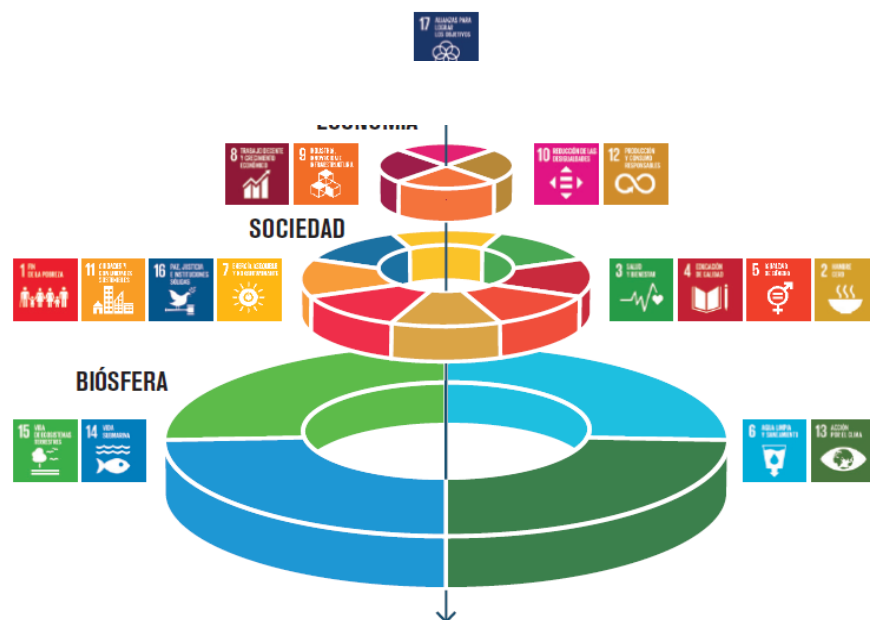
Figura 2: La economía y la sociedad dependen de una biosfera saludable.

Es así como Schultz, Tyrrell, & Ebenhard (2016), plantean como base del desarrollo económico y social, a los ecosistemas saludables y resilientes. Estos autores afirman que la pérdida de biodiversidad en estos, podría llegar a afectar gravemente los negocios, la seguridad alimentaria y el bienestar social en todo el mundo. Tal como se observa en la figura 2 1 , los ODS relacionados al ambiente (vida submarina (14), de ecosistemas terrestres (15), agua limpia y saneamiento (6), y acción por el clima (13)), son la base para el desarrollo de los demás objetivos, pues tal como se mencionó anteriormente, los sistemas naturales son aquellos que proporcionan los servicios vitales, razón por la cual, sustentan la vida en el planeta, y permiten, asimismo, llegar a un desarrollo sostenible.