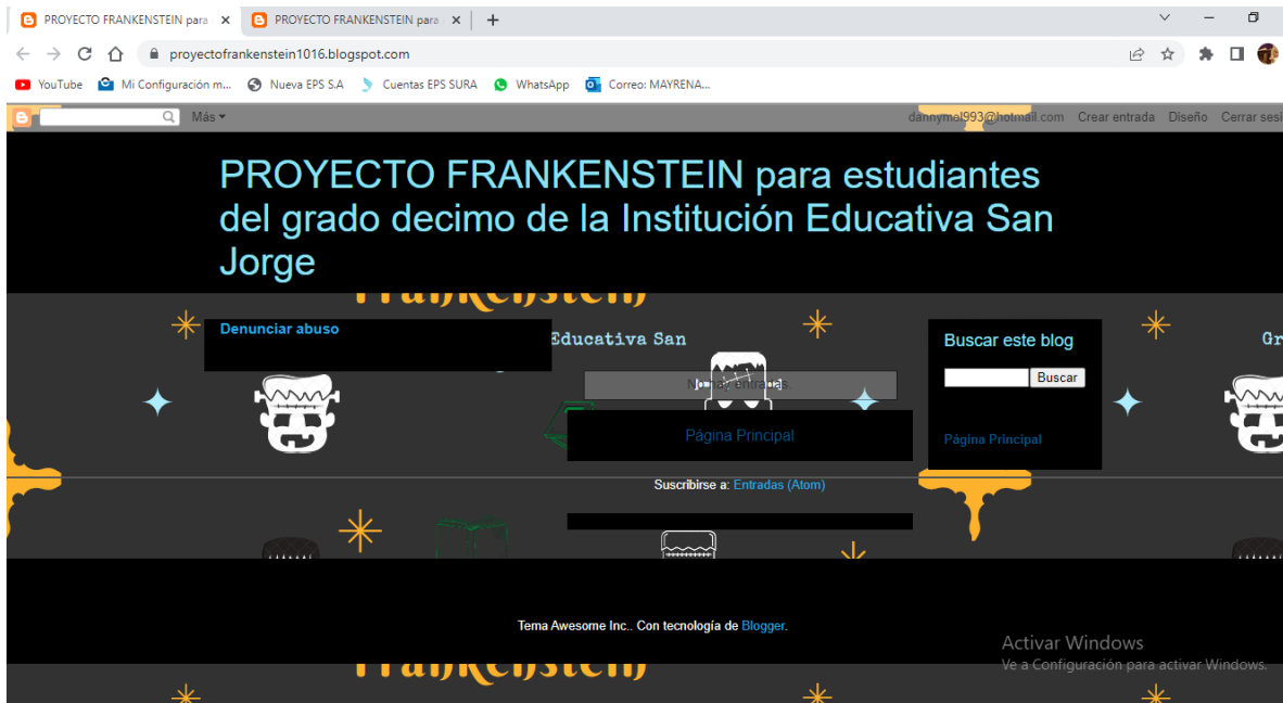
Ilustración 6. Proyecto Frankenstein