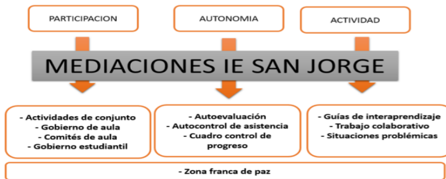
Ilustración 2. Mediaciones I.E. San Jorge