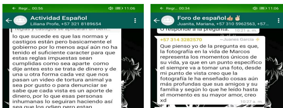
Ilustración 6. Redes sociales como herramienta de participación

El manejo de redes sociales, potencializo en el proyecto, el trabajo colaborativo, donde se visualizó un correcto uso de redes sociales, para crear grupos iniciales de trabajo, compartir sus opiniones, reflexionar inicialmente, sobre aquello que se buscaba encontrar, analizar y transmitir de acuerdo a la asignación del docente. Crear grupos de whatsapp para discutir los temas planteados, permitió tener lugares comunes para ellos, como escenario educativo, además de darle un valor agregado a una red social bastante utilizada por ellos. En este aspecto, se logró tener una fase inicial de manejo de redes sociales, como herramienta didáctica de comunicación y desmitificar el uso de redes sociales como un tabú en el buen funcionamiento del trabajo de aula.