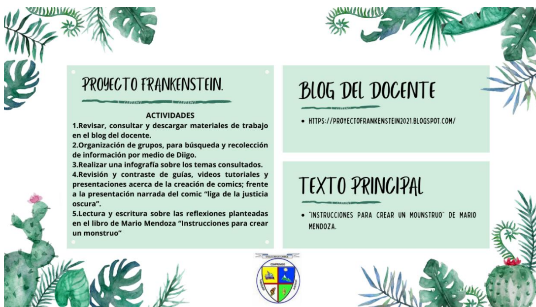
Ilustración 1. Presentation Del Proyecto