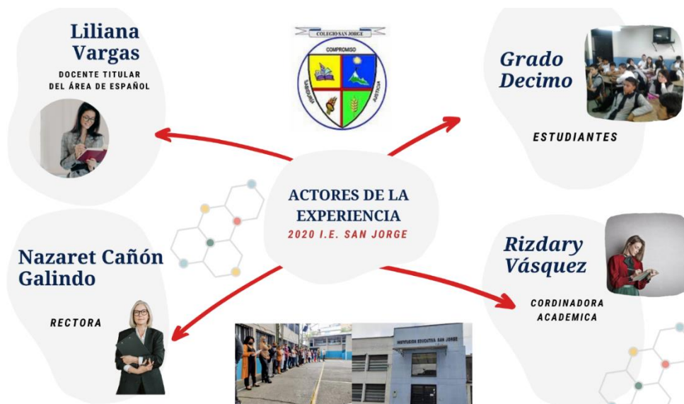
Ilustración 4, Actores de la experiencia.

Los actores claves, para incluir el PROYECTO FRANKENSTEIN , como estrategia didáctica de enseñanza de la literatura por medio de la TIC, finalizando con la creación de un comic con herramientas digitales en una red social fueron: