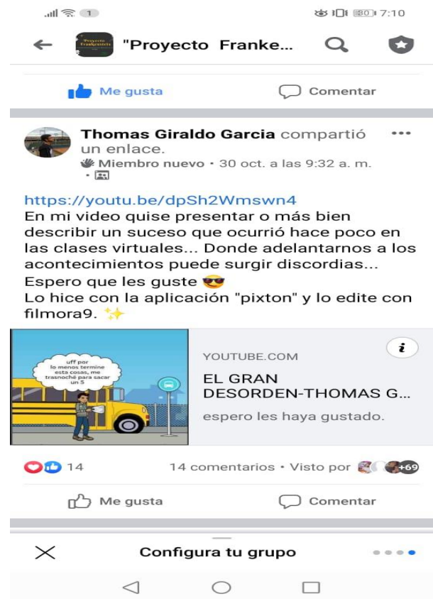
Ilustración 5. Proyecto Frankenstein en Facebook

El grupo de WhatsApp permitió, revisar los productos finales de los estudiantes, en el momento de subir su Comic a la red social Facebook.