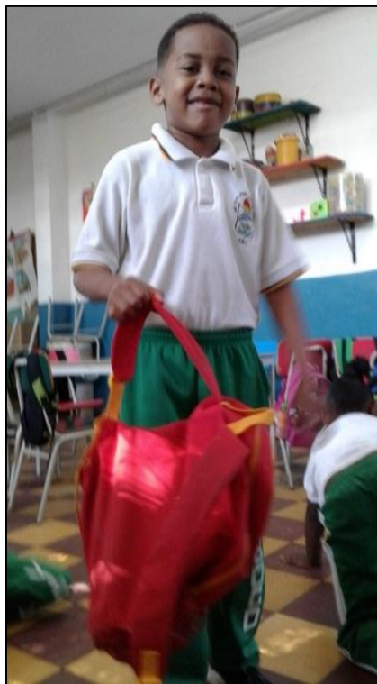
Foto 7. Actividad 7 “El rey manda” trae el maletín rojo que se pidió.

E4. Siii, había que traerle lo que ella pedía.(Notas de diario de campo, sesión 7)