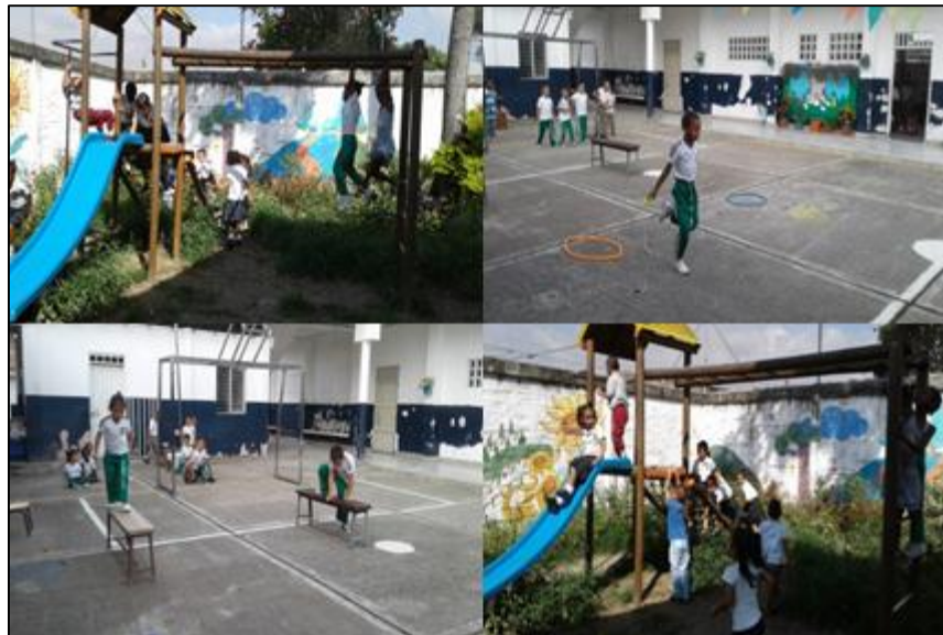
Foto 2. Actividad 10 “El patio de mi escuela” jugando colaborativamente