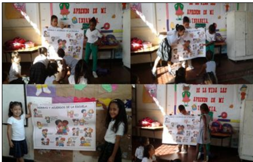
Foto 1. Actividad 9 “Veo, veo” los niños imitan con ejemplos de su vida cotidiana la imágenes de la cartelera sobre normas.

con las normas y se relacionan con ellas, las identifican y las practican; ahí si podremos hablar de fortalecer las normas para la convivencia.