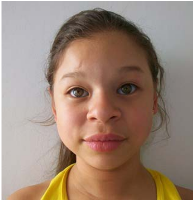
Figura 1. En esta figura se aprecian: pliegue epicántico, puente nasal ancho, escleras azules y ojos verdes con un patrón estrellado del iris, nariz prominente y bulbosa, filtrum largo y labios gruesos.