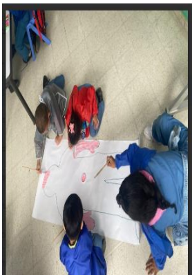
Imagen 6 Decoración de la silueta

En esta actividad se demostró la capacidad de autonomía que tienen los niños para decidir por sí solos sus materiales, como decorar y luego exponer la figura realizada ( ver imágenes 6, 7, 8 y 9 )