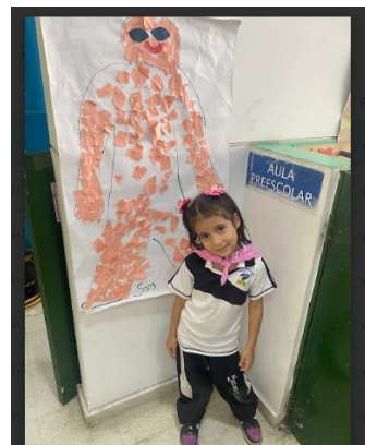
Imagen 7 Decoración