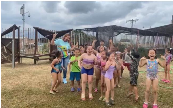
Imagen 16 actividad del viernes

Con la situación anterior se logra evidenciar que la familia juega un papel importante en el agenciamiento infantil, y puede fomentar este concepto de varias maneras. En primer lugar, puede proporcionar a los niños un ambiente seguro y protector que les permita explorar y experimentar sin temor a equivocarse. En segundo lugar, puede brindar a los niños las herramientas necesarias para desarrollar habilidades y destrezas que les permitan ser agentes activos en su propio aprendizaje.