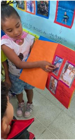
Imagen15 Presentación de la historia de su vida

de libro. Su mamá decía que le parecía muy significativo realizarlo así, para que ella lo pudiera conservar por muchos años más y recordara la actividad por la que lo había realizado. Aquí se vislumbra que la actividad trascendió lo académico y tuvo un valor significativo para cada familia y estudiante. Con este hecho se logra destacar el valor que las familias le dieron a la actividad, para estas se volvió importante, tanto, que aquí la madre de familia pensó en la durabilidad de este para ser recordado por muchos años, es decir que no solo fue algo para el momento o para el aula de clases, sino para la vida, trascendiendo lo académico del pedido ( ver imagen 15 ).