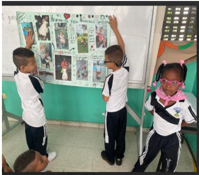
Imagen 10 Autonomía

trabajen con el tablero borrable personal, ella quiere que se repase la escritura del nombre completo con apellidos y desea pasar revisando si sus compañeros lo escriben o no.