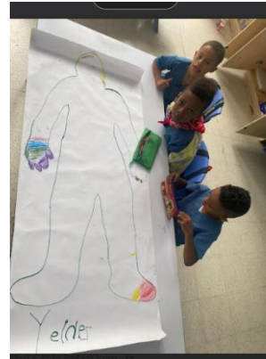
Imagen 9 Decoración

De este valioso e importante momento se pueden rescatar procesos y situaciones que dan luces sobre los comportamientos y habilidades que tienen los niños dentro del proceso de aprendizaje, vemos cómo los niños se convierten en sujetos activos dentro de su propia educación a partir de una actividad que logra combinar la socialización, la autonomía, la participación activa y el liderazgo, ya que los niños y niñas aprenden a valorar el trabajo en equipo, aprenden a entender la importancia de escuchar al otro y así lograr ideas significativas, también experimentar tomar la iniciativa de decidir en la ejecución de las actividades, de elegir de qué manera lo hará para que su aprendizaje sea de impacto positivo, de igual manera los niños y niñas serán participantes activos dentro de su proceso de aprendizaje, logrando experimentar novedades dentro del mismo y actuando activamente en todas las actividades que se realizan al interior del aula, todo esto combinado logra construir un ser humano íntegro, caracterizándose por ser una persona que propone, crea, lidera, dispone, recibe, pero que sobre todo sea crítico y reflexivo.