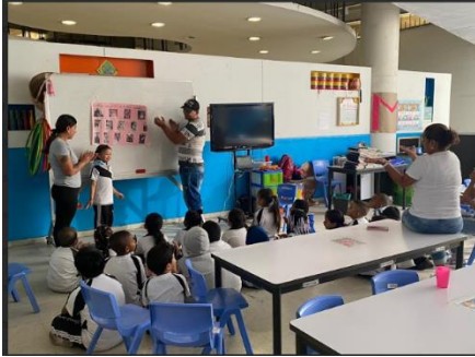
Imagen 13 cartelera

Desde que se planeó la actividad dentro del proyecto “así soy” se pensó en el papel de la familia, ya que una de las actividades dentro de la semana era llevar a sus padres a la escuela el día viernes para realizar un compartir con los compañeros y la docente, pero también de planear entre el equipo una actividad lúdica, pedagógica o académica donde ellos y ellas (padres, madres y equipo de personajes de la semana) fueran los que la explicaran y la llevaran a cabo con los demás integrantes del grupo. Todo esto ocasionó reacciones de felicidad, sorpresa y asombro en los niños y niñas al ver sus padres dentro del aula de clases en un ambiente completamente distinto a una reunión, con estas actividades se tuvo la oportunidad de evaluar la participación de los padres y la actitud de los niños y niñas. ( ver imagen 14 )