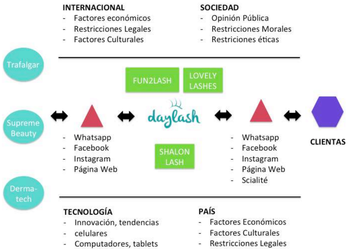
CUADRO #1 – MAPA DE MERCADO DIGITAL